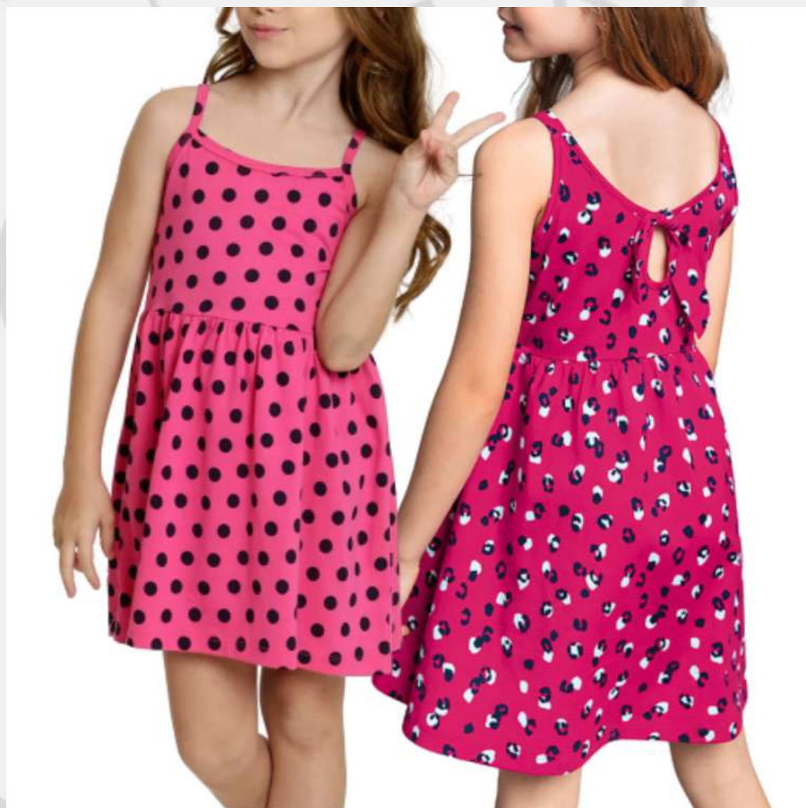
Vestido Em Malha com Alcinha (2 aos 10 anos)