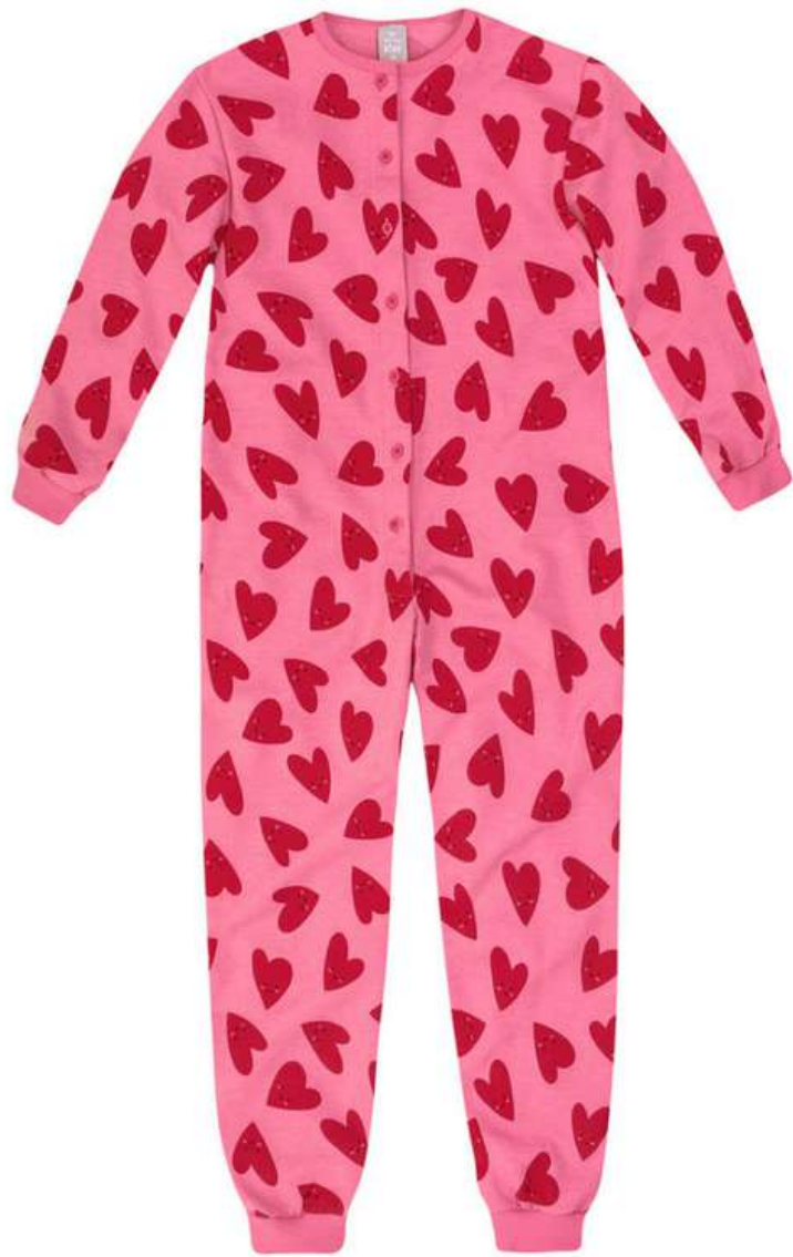
Macacão Pijama (1 aos 10 anos)