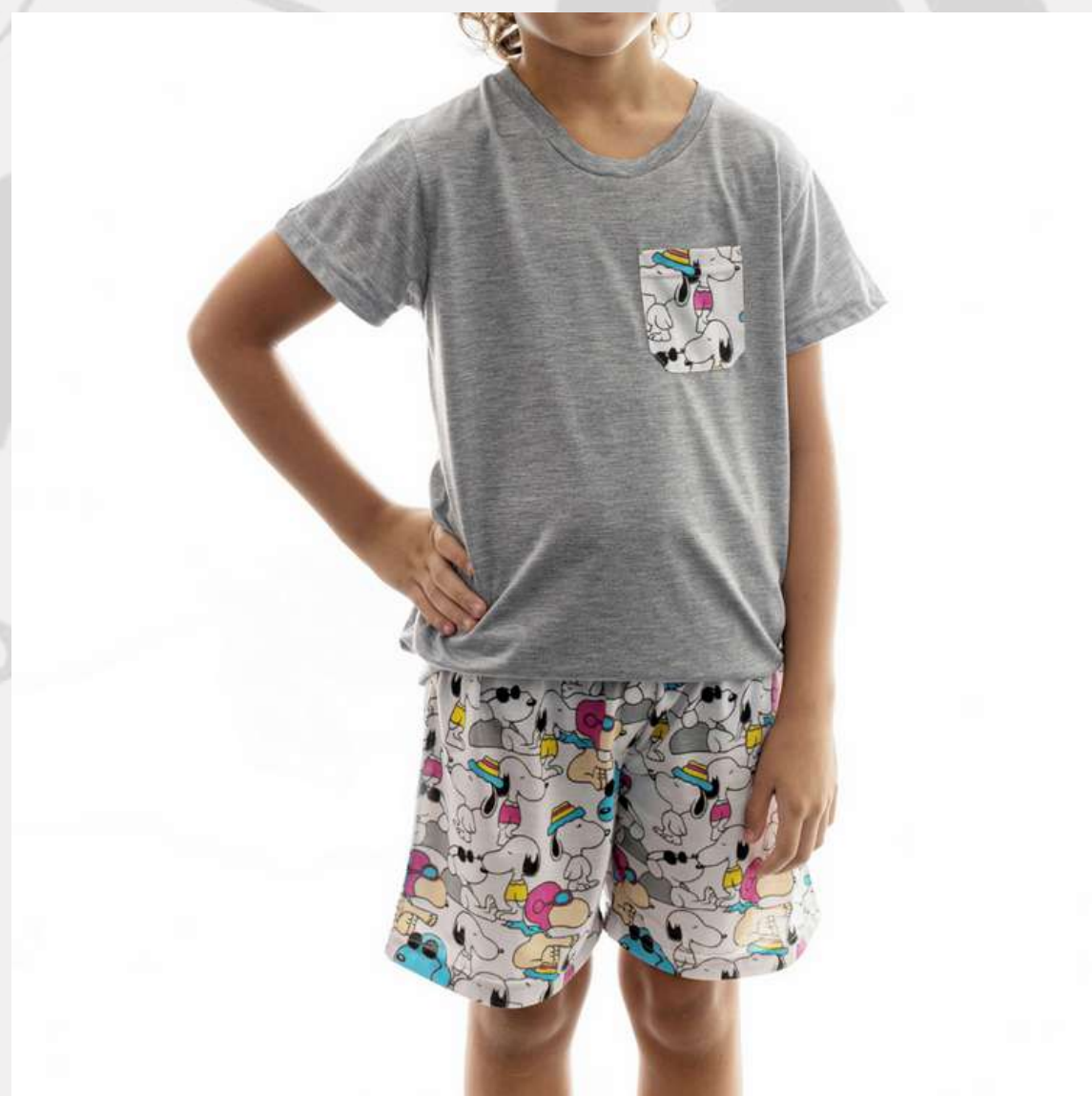
Conjunto Pijama Masculino Malha (2 aos 16 anos)