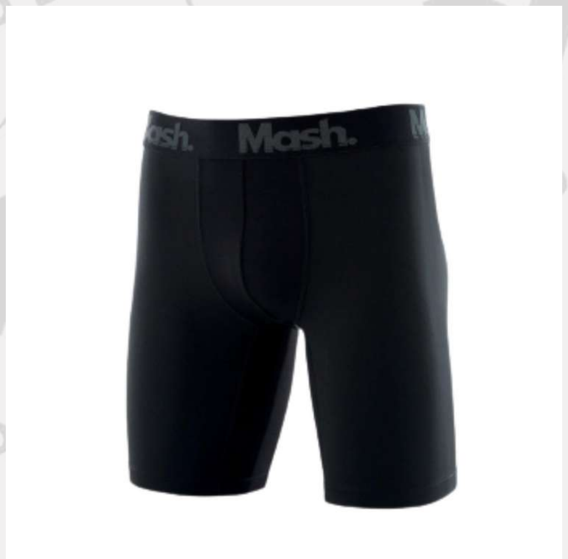
Short Ciclista Compressão (4 a 16 anos)