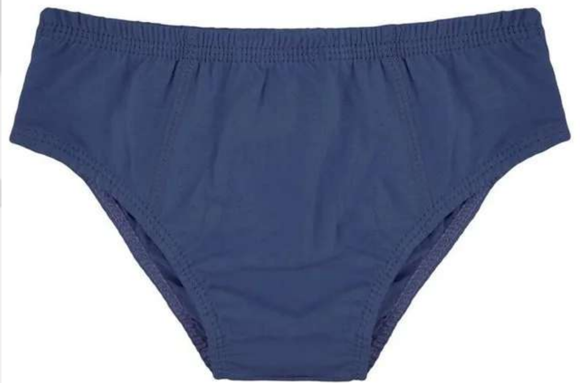
Cueca Básica Infantil (1 aos 10 anos)