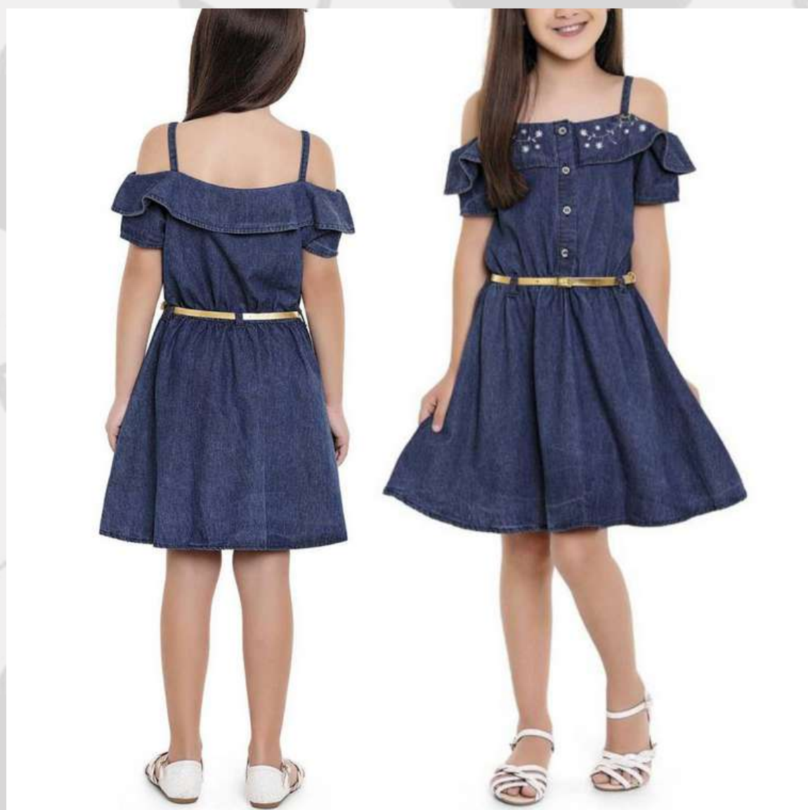
Vestido Ciganinha Jeans (6 aos 12 anos)