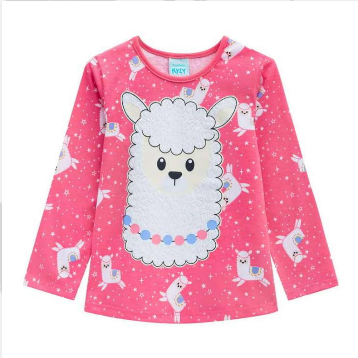
Blusa de Pijama Infantil Verão (2 a 16 anos)