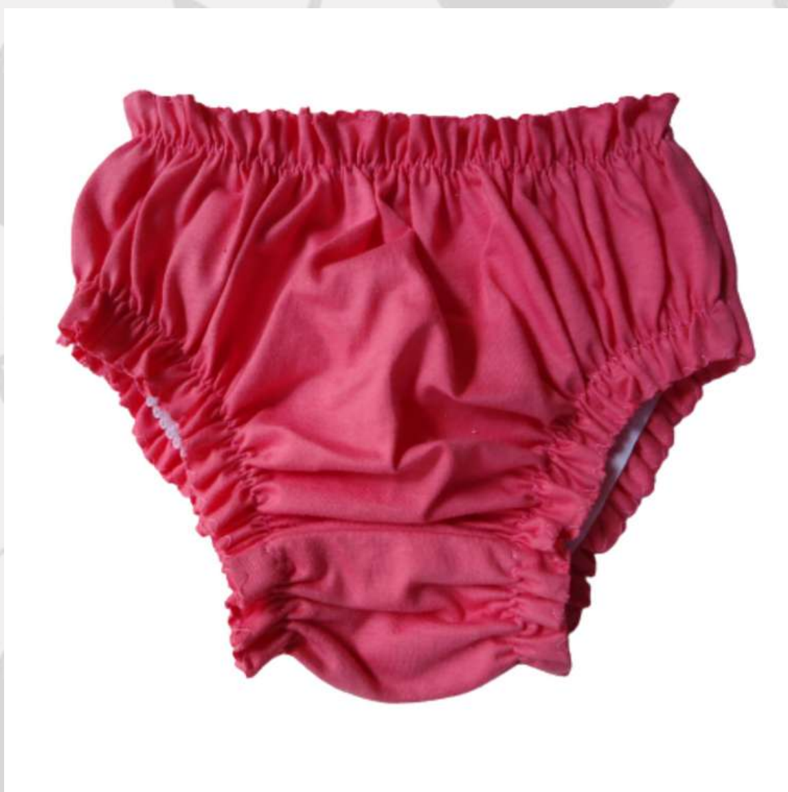
Calcinha Básica Bebê (P ao GG)