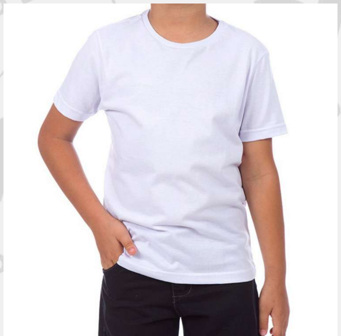
Camiseta Tradicional Infantil (2 aos 16 anos)