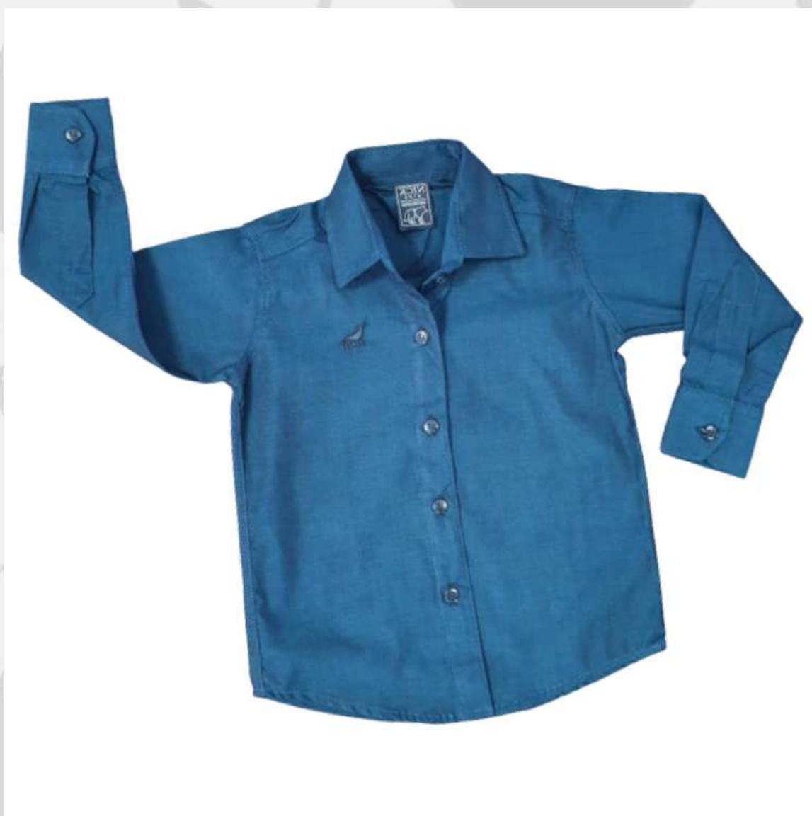
Camisa Social Masculina Manga Longa (2 aos 16 anos)