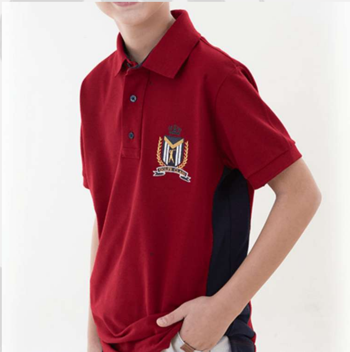
Polo Recorte Lateral Manga Longa e Curta (2 a 16 anos)