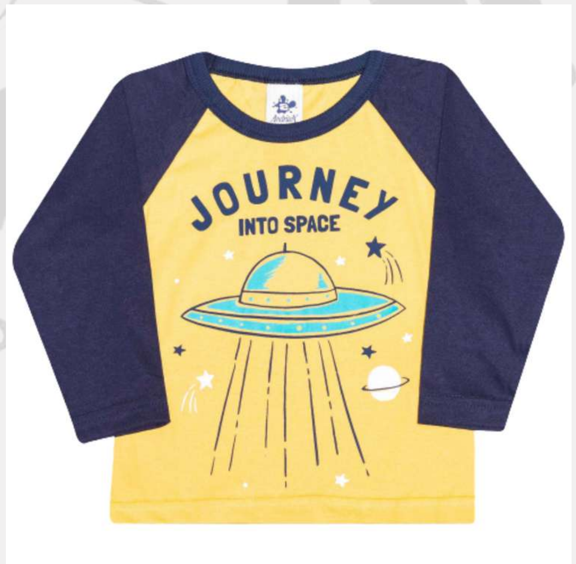
Blusa Raglan Inverno Pijama (2 aos 16 anos)