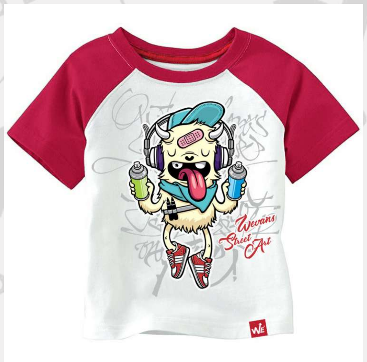
Camiseta Raglan Infantil Manga Curta (2 aos 16 anos)