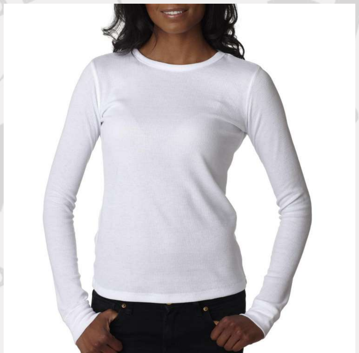
Baby Look Tradicional Manga Longa (2 aos 16 anos)