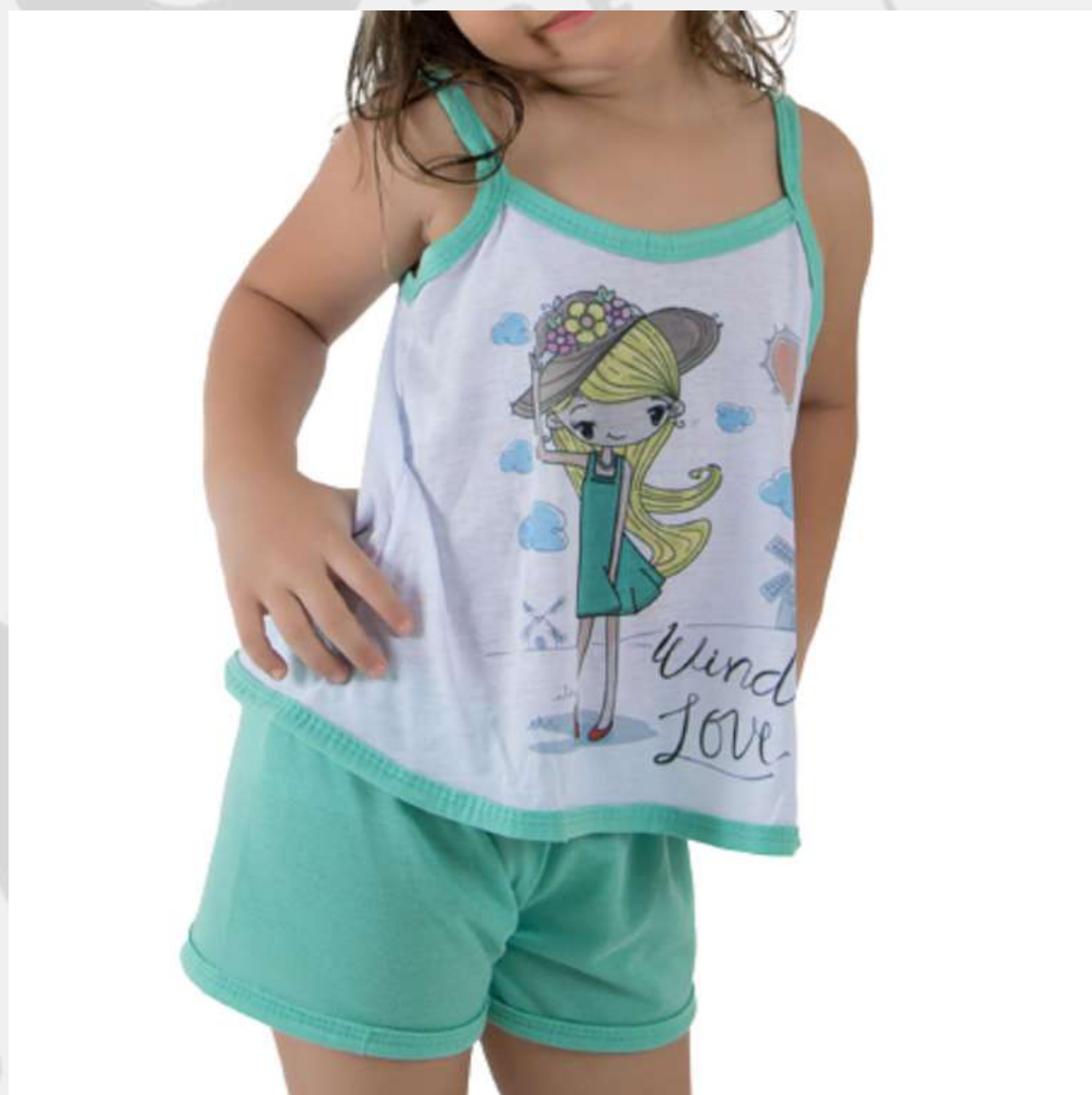
Conjunto Pijama Alcinha Verão (1 aos 8 anos)