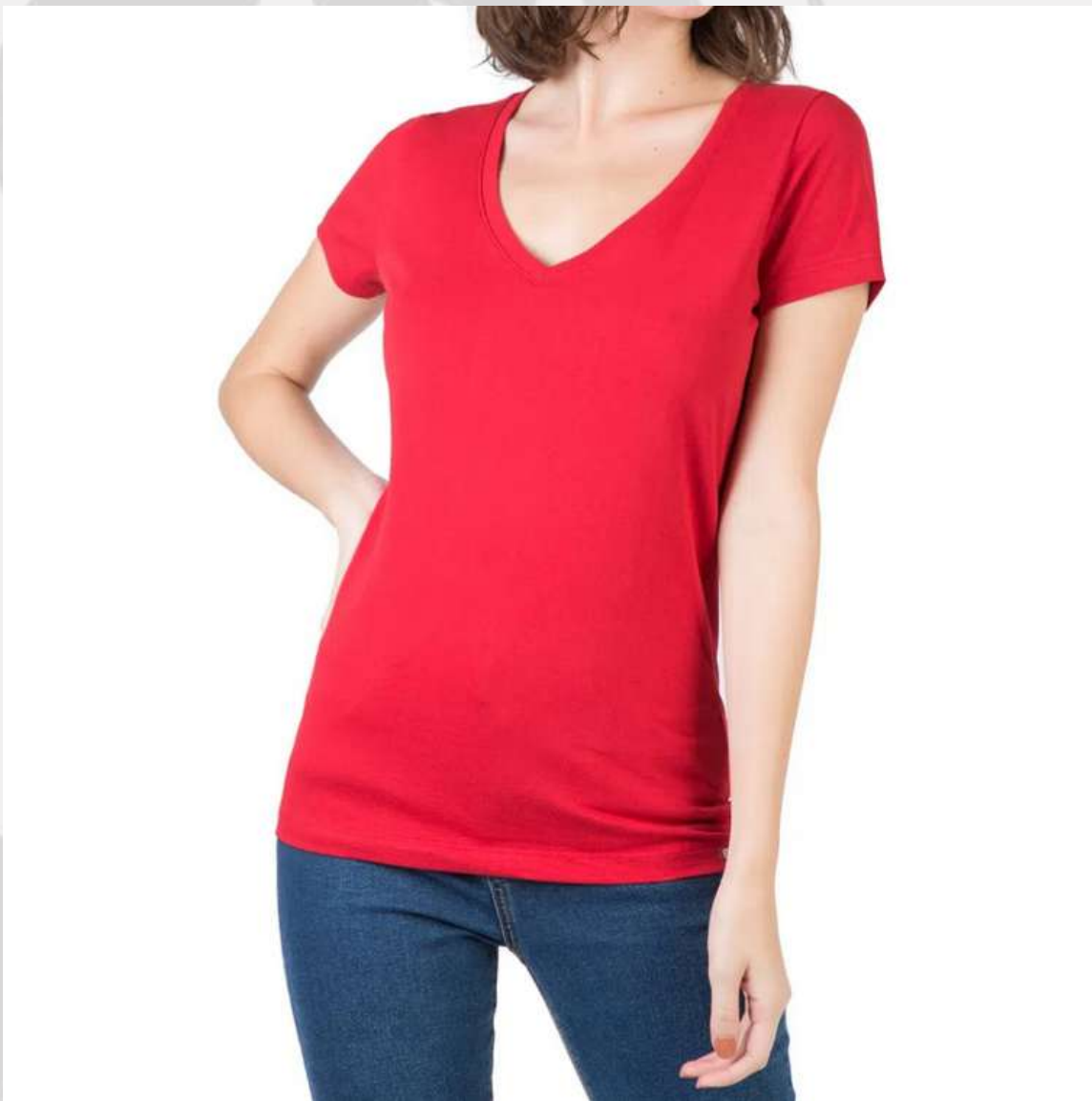
Baby Look Tradicional Gola V (2 aos 16 anos)