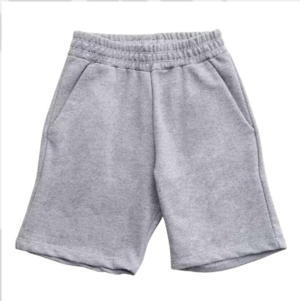
Bermuda Moletom Infantil (2 aos 16 anos)