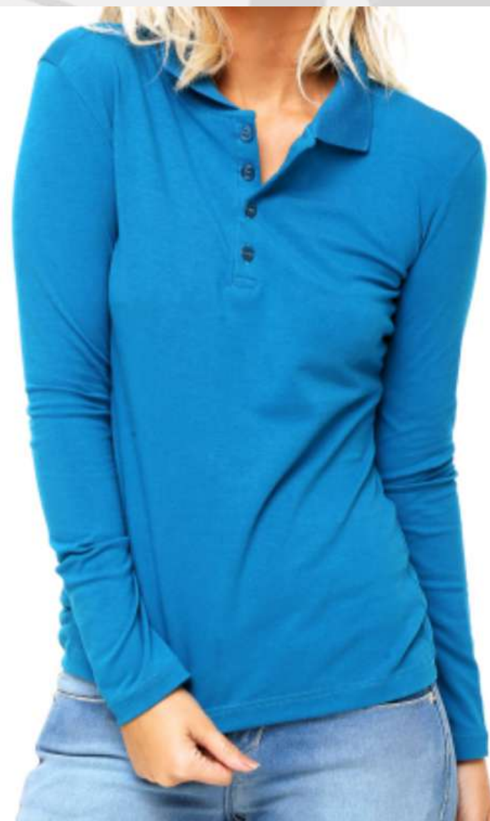
Baby look Gola Polo Tradicional Manga Longa (2 aos 16 anos)