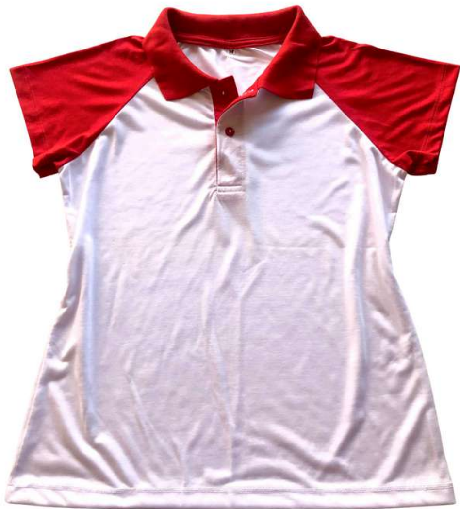
Baby look Gola Polo Raglan (2 aos 16 anos)