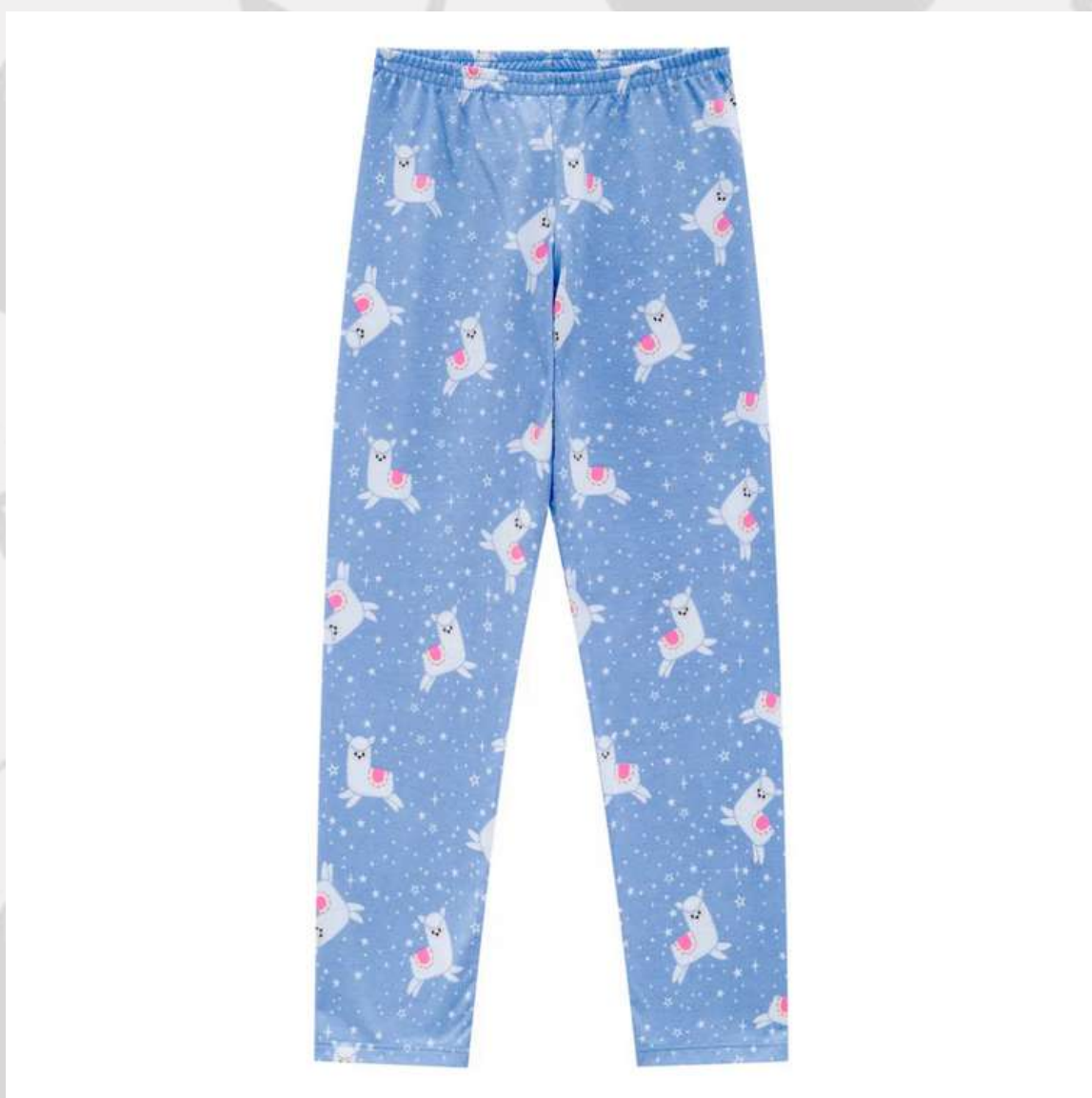
Calça Pijama Verão (2 aos 16 anos)