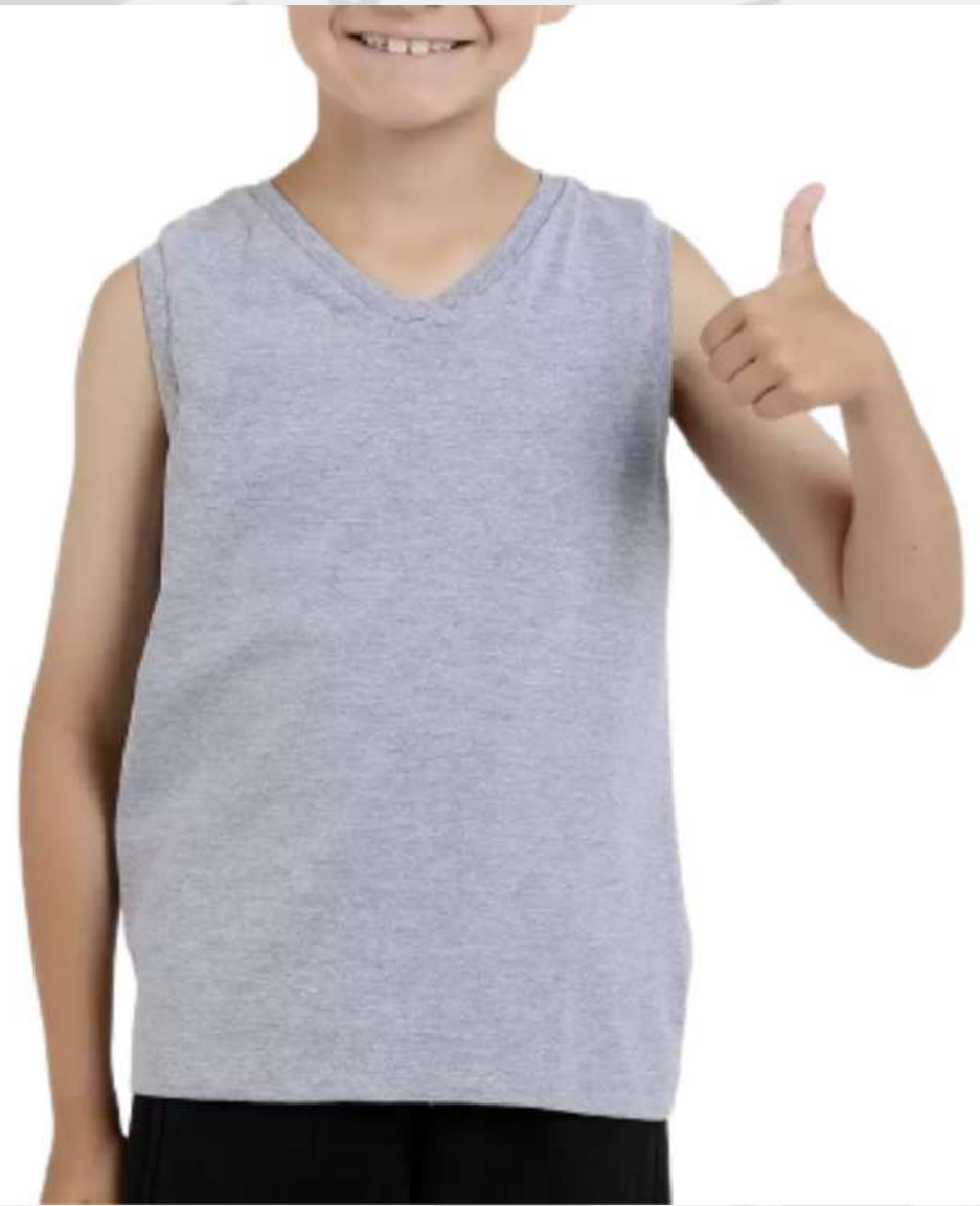
Regata Tradicional Infantil Gola V (2 a 16 anos)