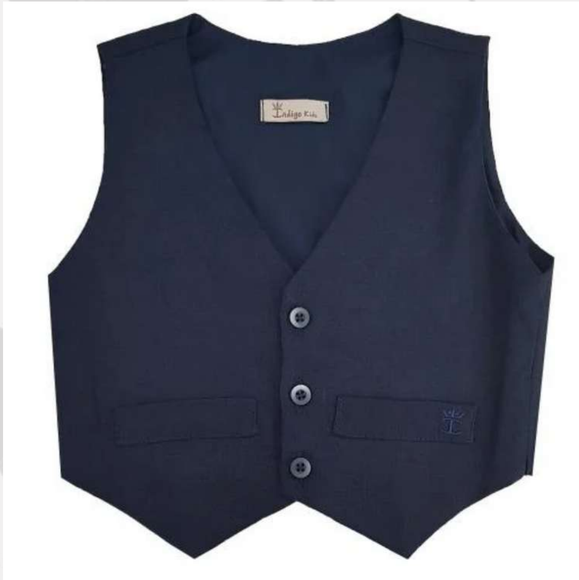
Colete Social Masculino (2 aos 16 anos)