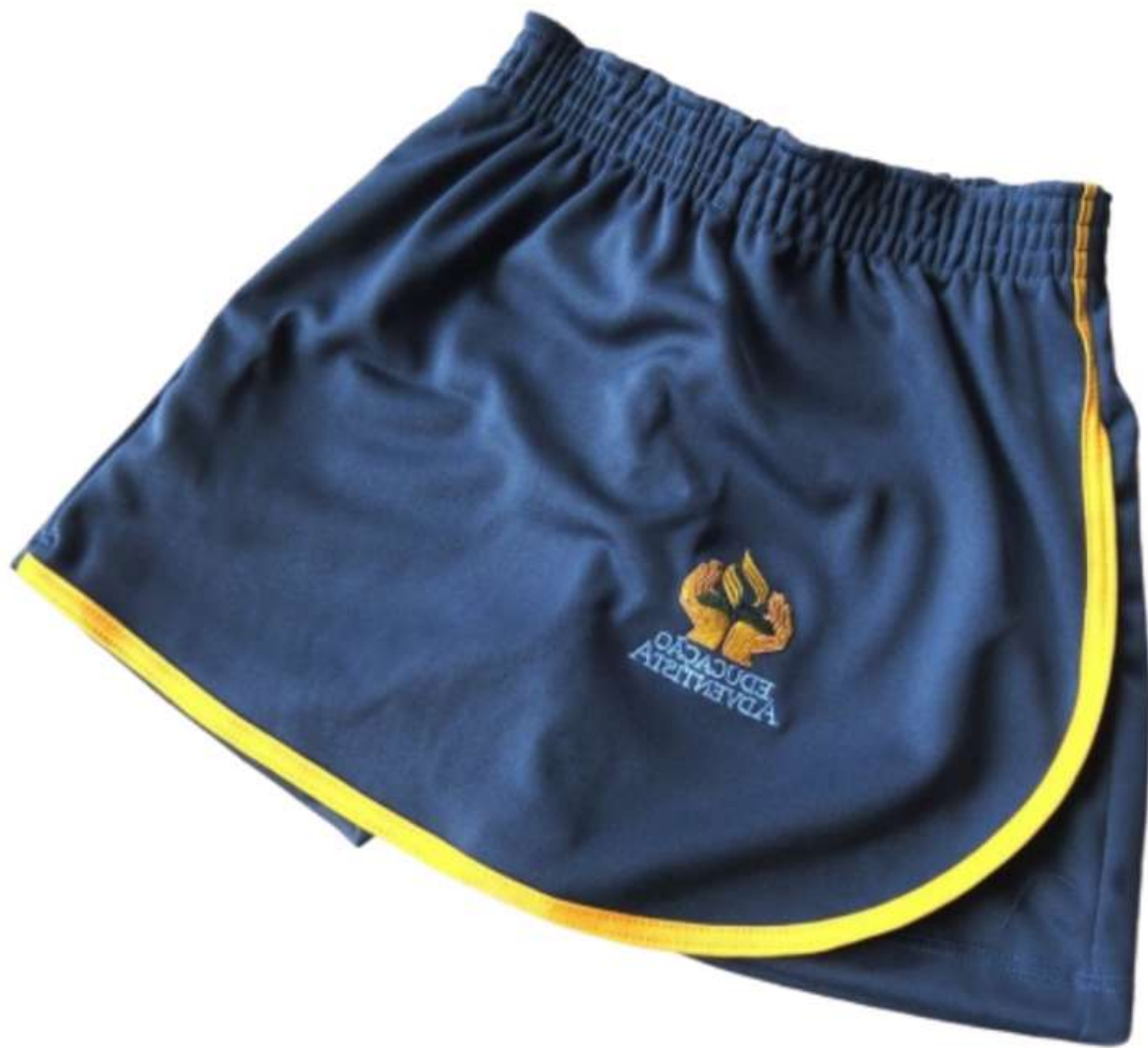
Short Saia Escolar (4 aos 14 anos)