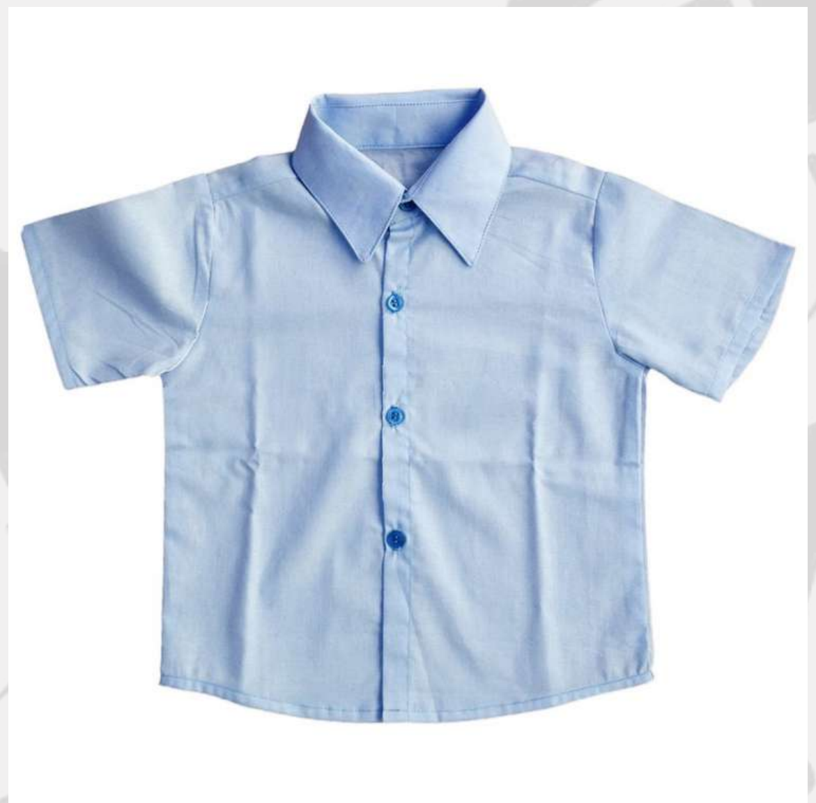
Camisa Social Masculina Manga Curta (1 aos 8 anos)