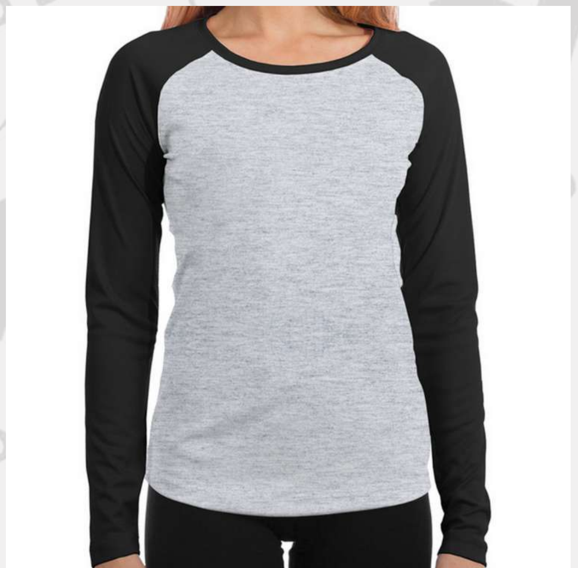
Baby Look Raglan Manga Longa (2 aos 16 anos)