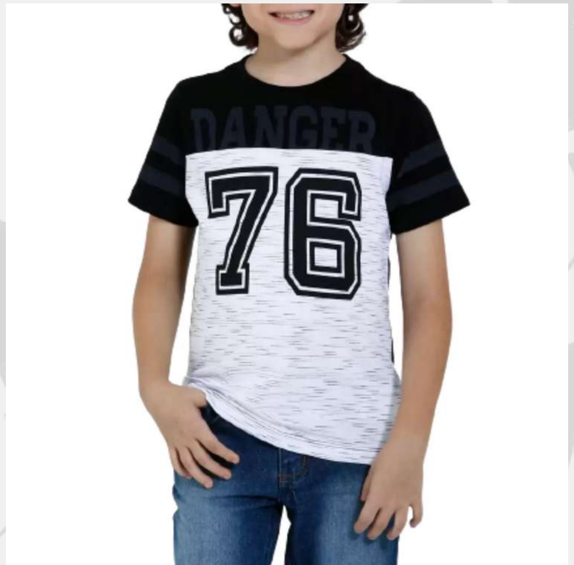
Camiseta Tradicional com Recorte na Manga (2 aos 16 anos)