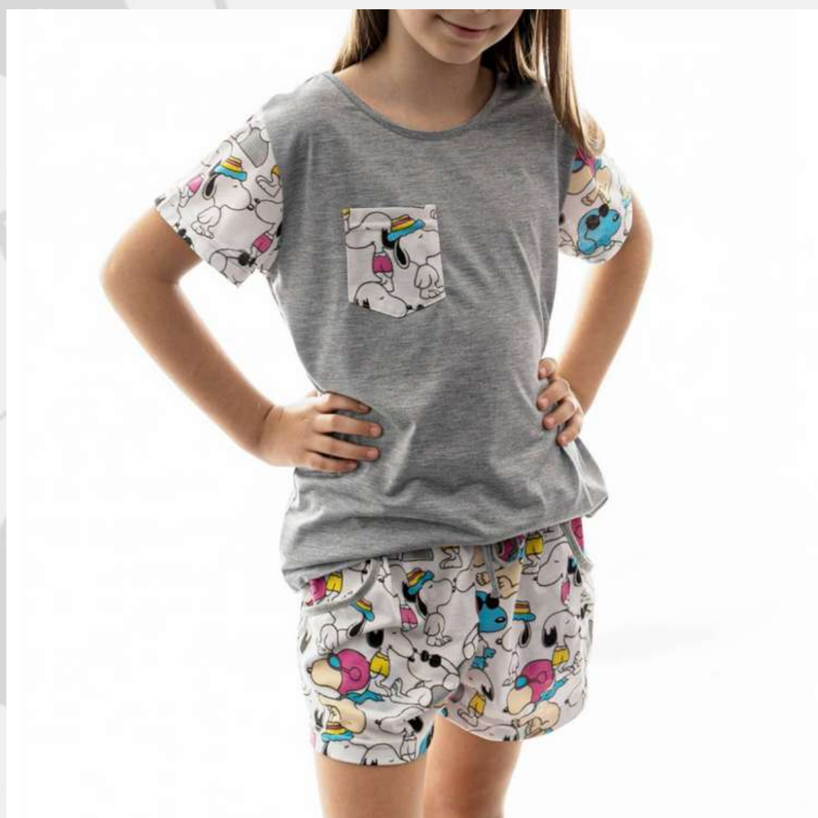
Conjunto Pijama Feminino Malha (2 aos 16 anos)