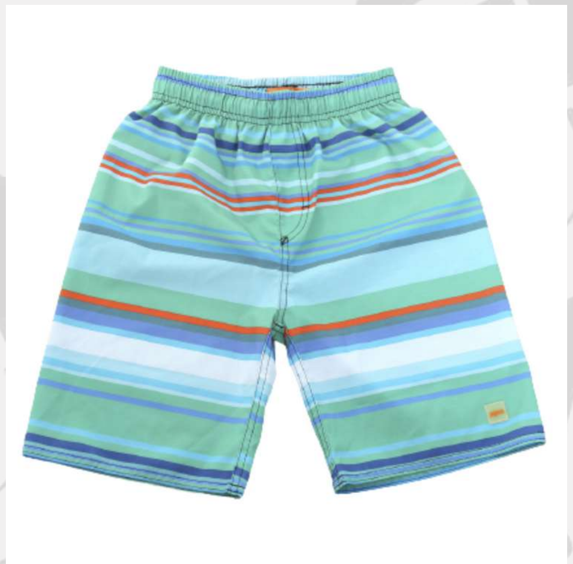
Short Infantil Masculino (2 aos 12 anos)