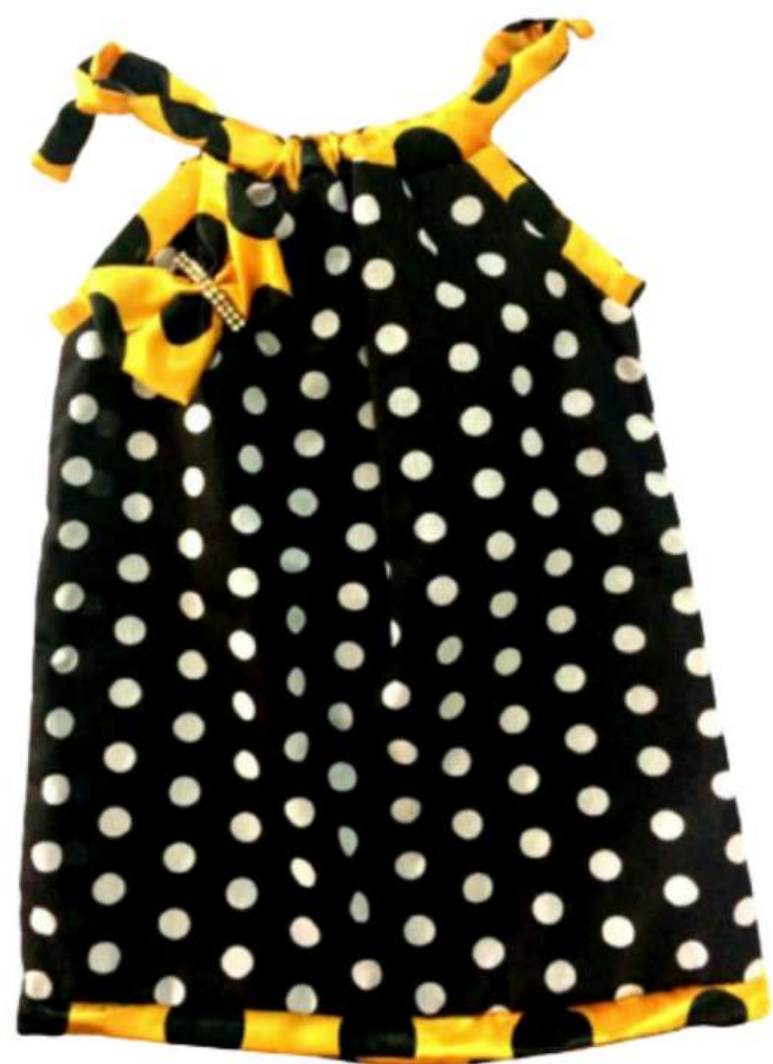
Bata infantil Básica (1 aos 8 anos)