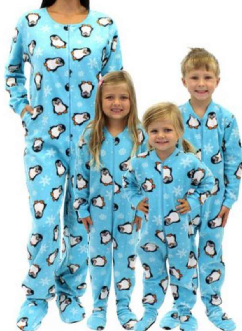
Macacão Pijama Com Pezinho (1 aos 18 anos)