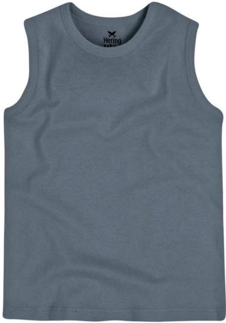
Regata Tradicional Infantil (2 a 16 anos)