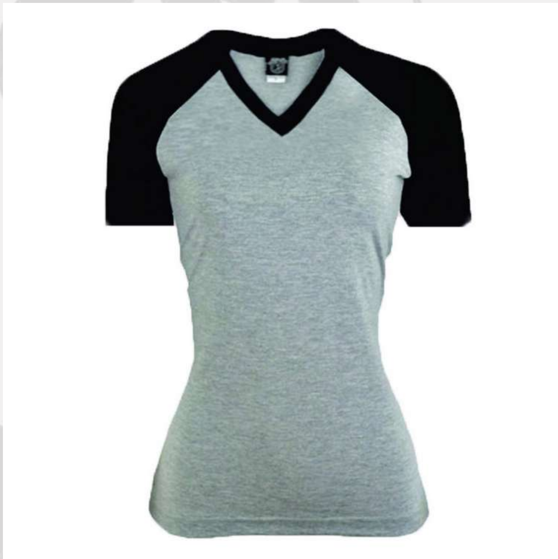
Baby Look Raglan Gola V (2 aos 16 anos)