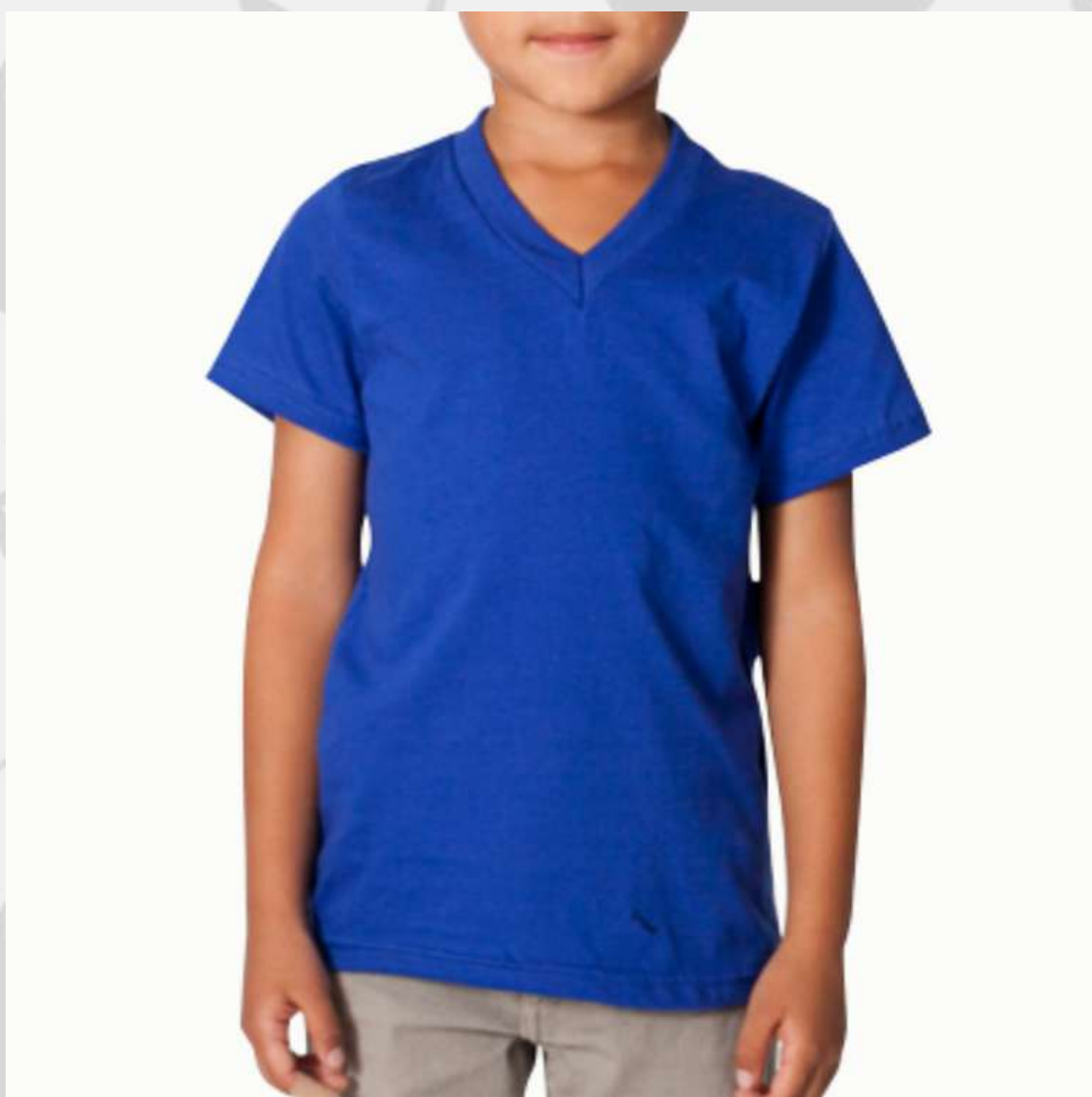
Camiseta Tradicional GOLA V Infantil (2 aos 16 anos)