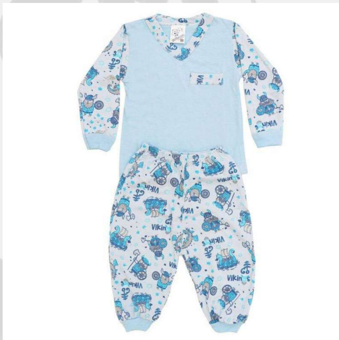
Conjuntinho Pijama Bebê (P ao GG)