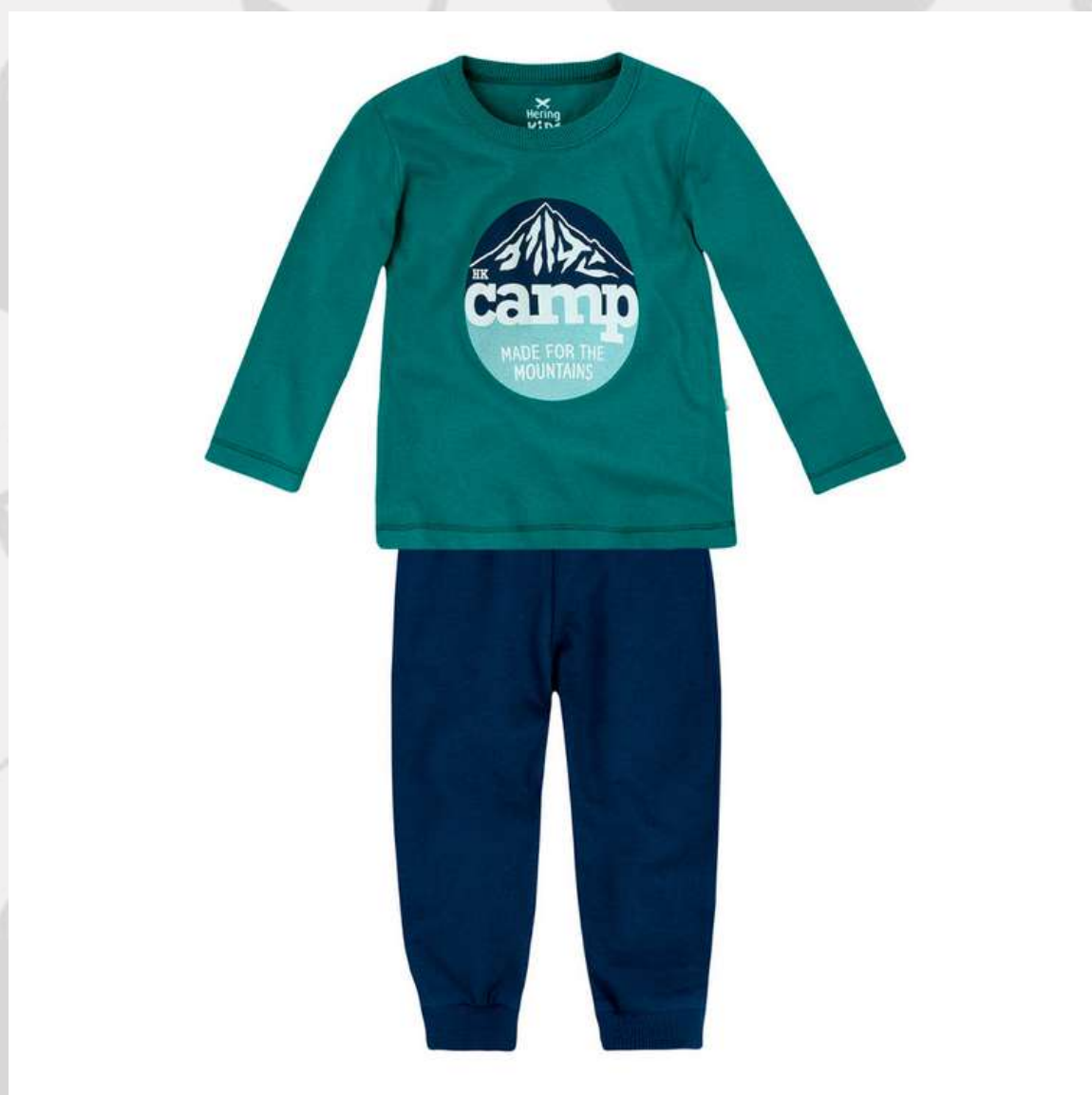
Conjunto Moletom Bebê (RN ao GG)