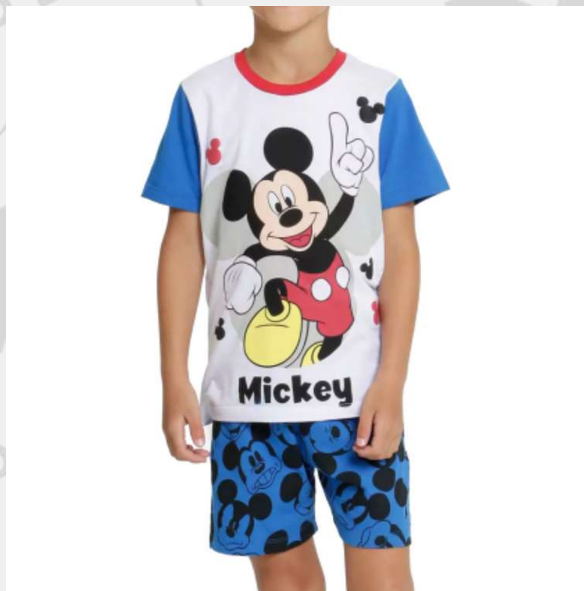
Pijama Infantil Verão Masculino (1 aos 12 anos)