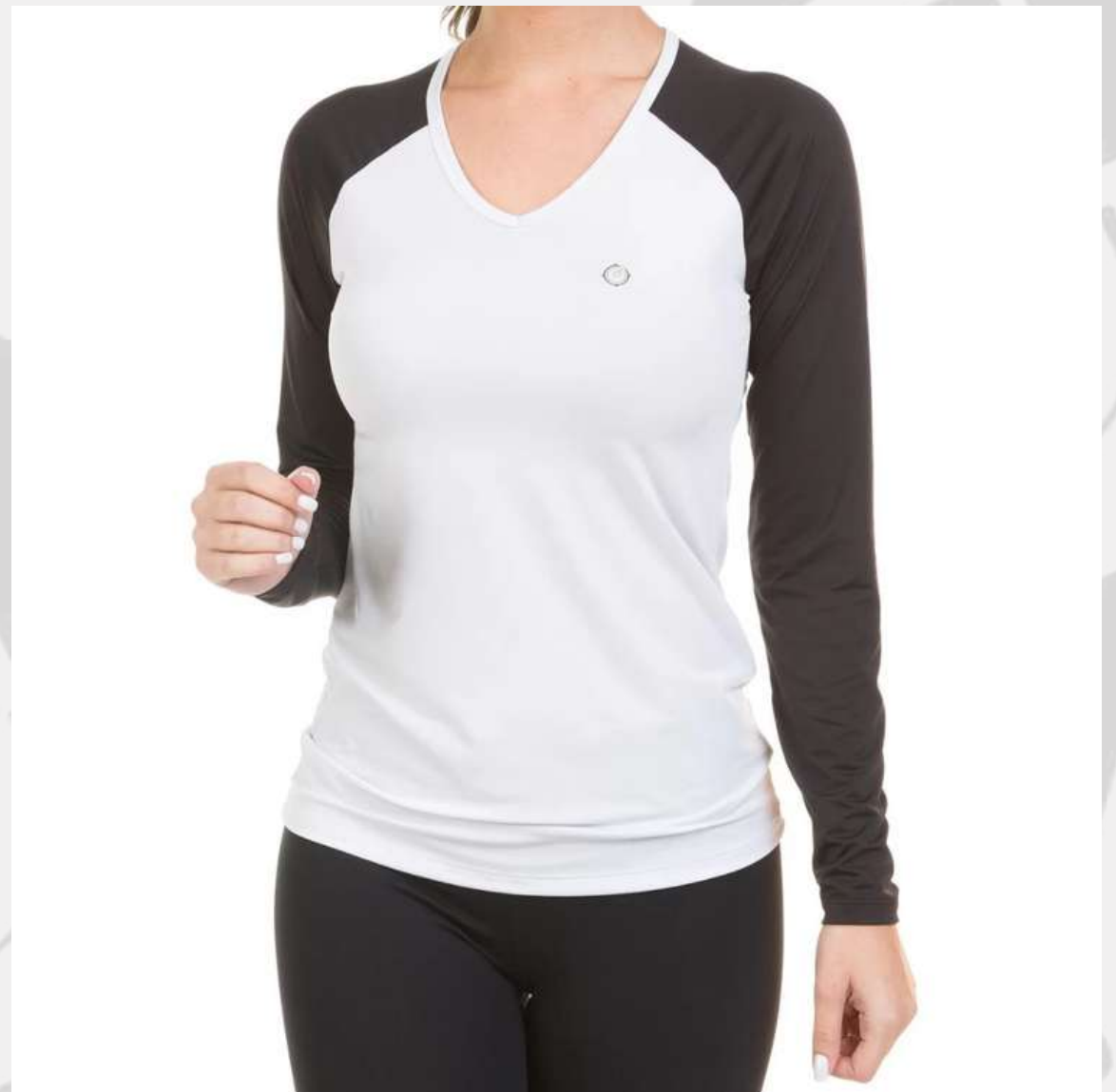
Baby Look Raglan Gola V Manga Longa (2 aos 16 anos)