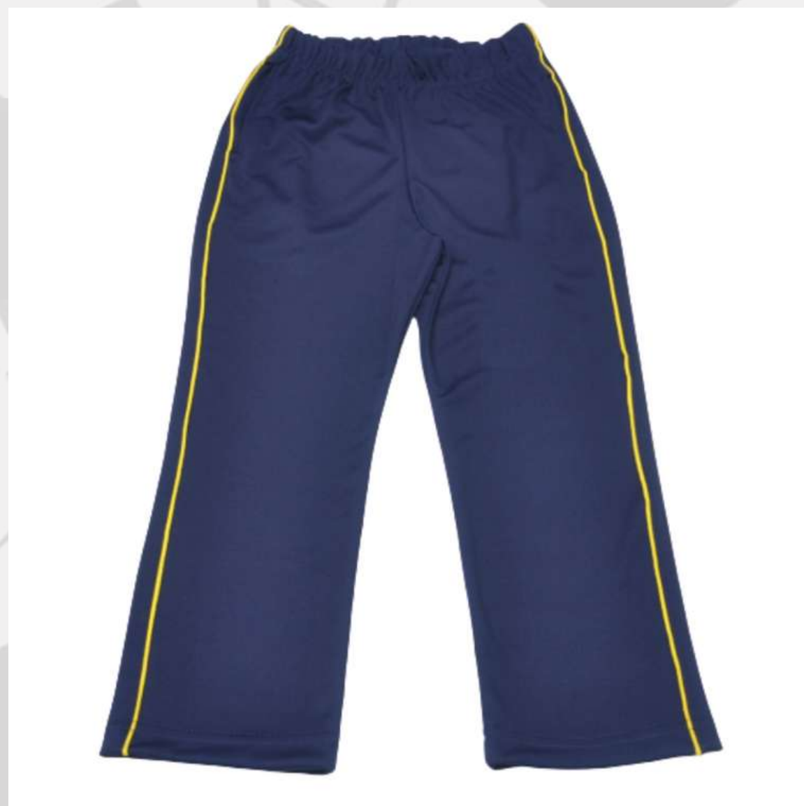
Calça Escolar Infantil (2 aos 14 anos)