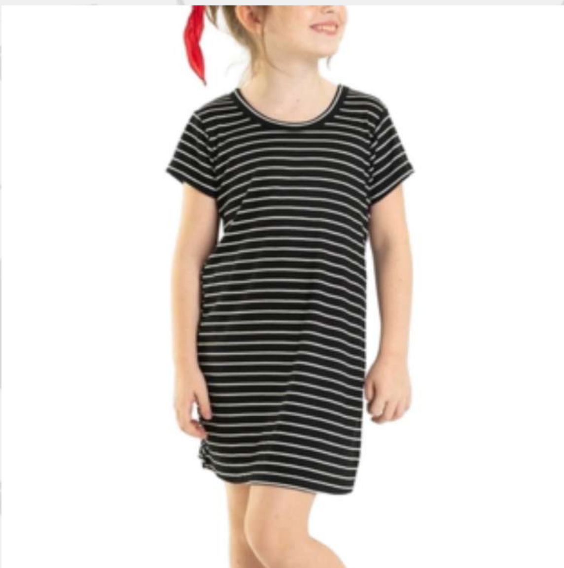
Vestido Baby Look (2 aos 16 anos)