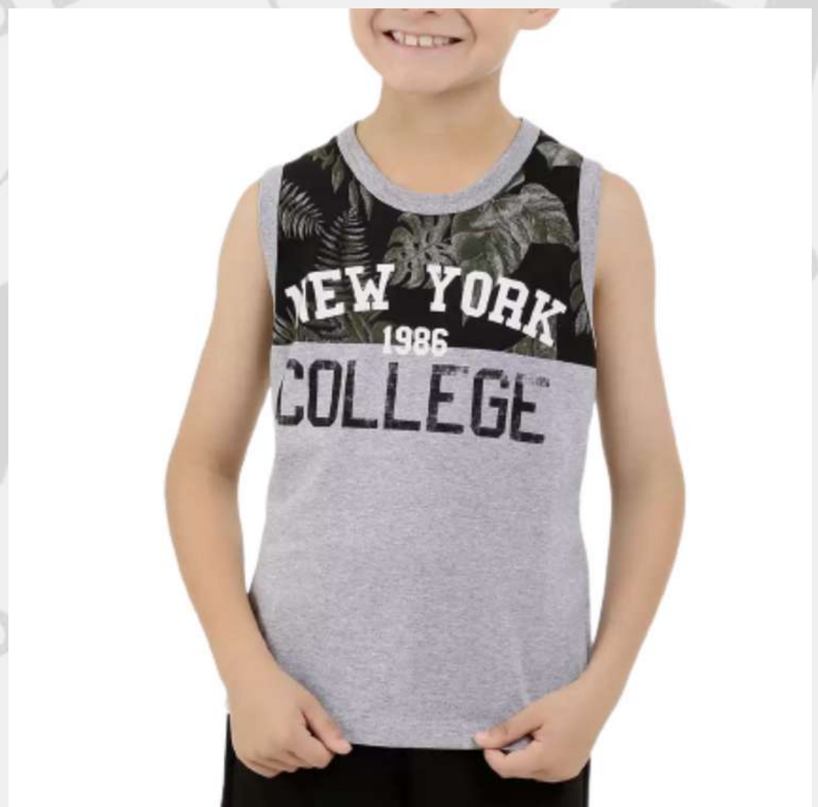
Regata Infantil com Recorte no Ombro (2 a 16 anos)