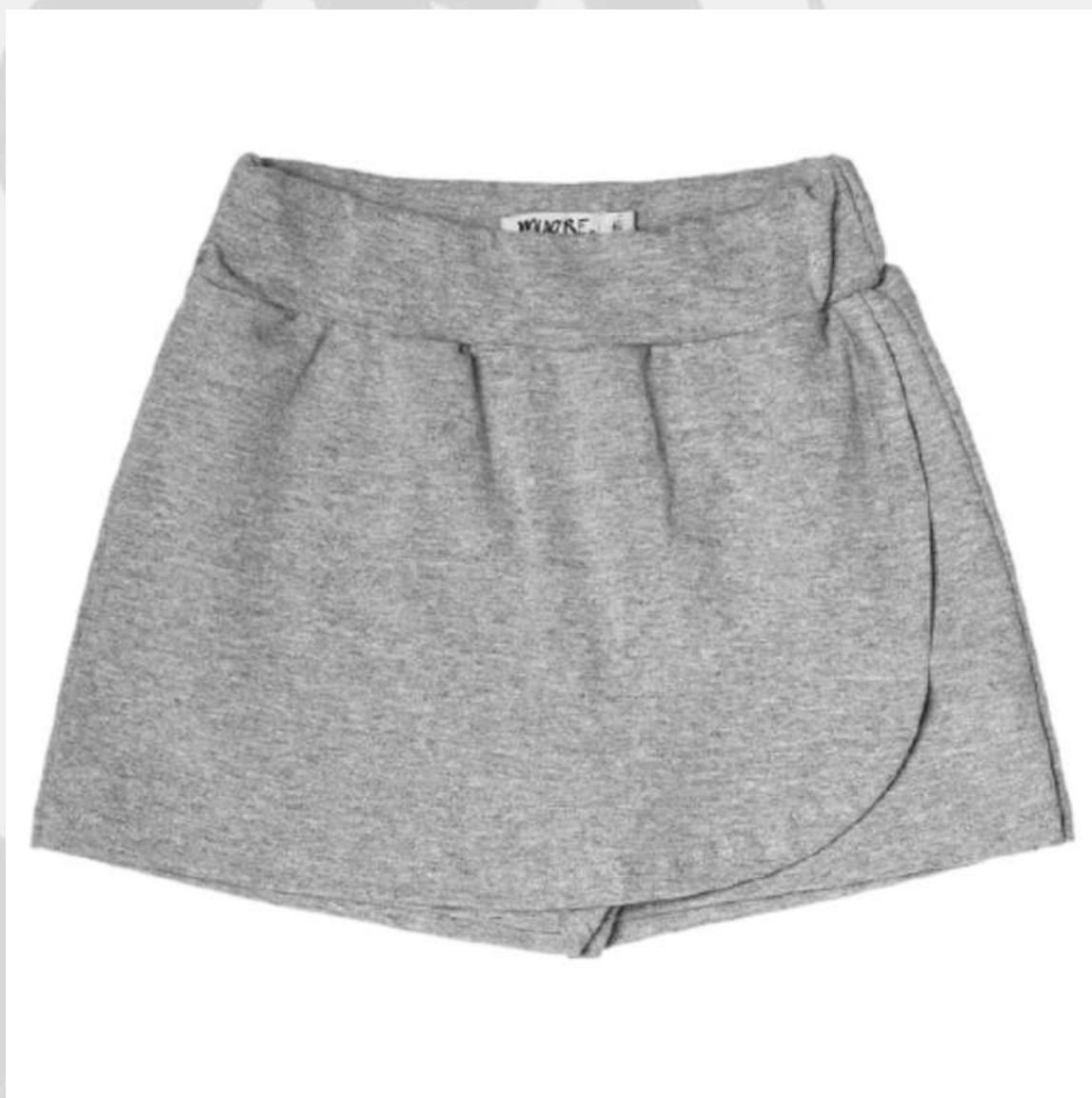
Short Saia Infantil Feminino (4 aos 14 anos)