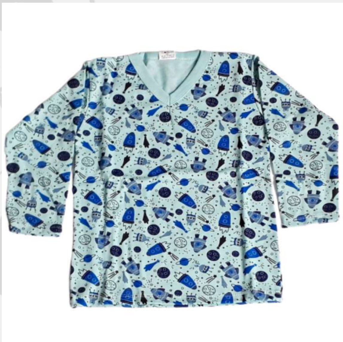
Blusa Pijama Gola V (2 aos 16 anos)