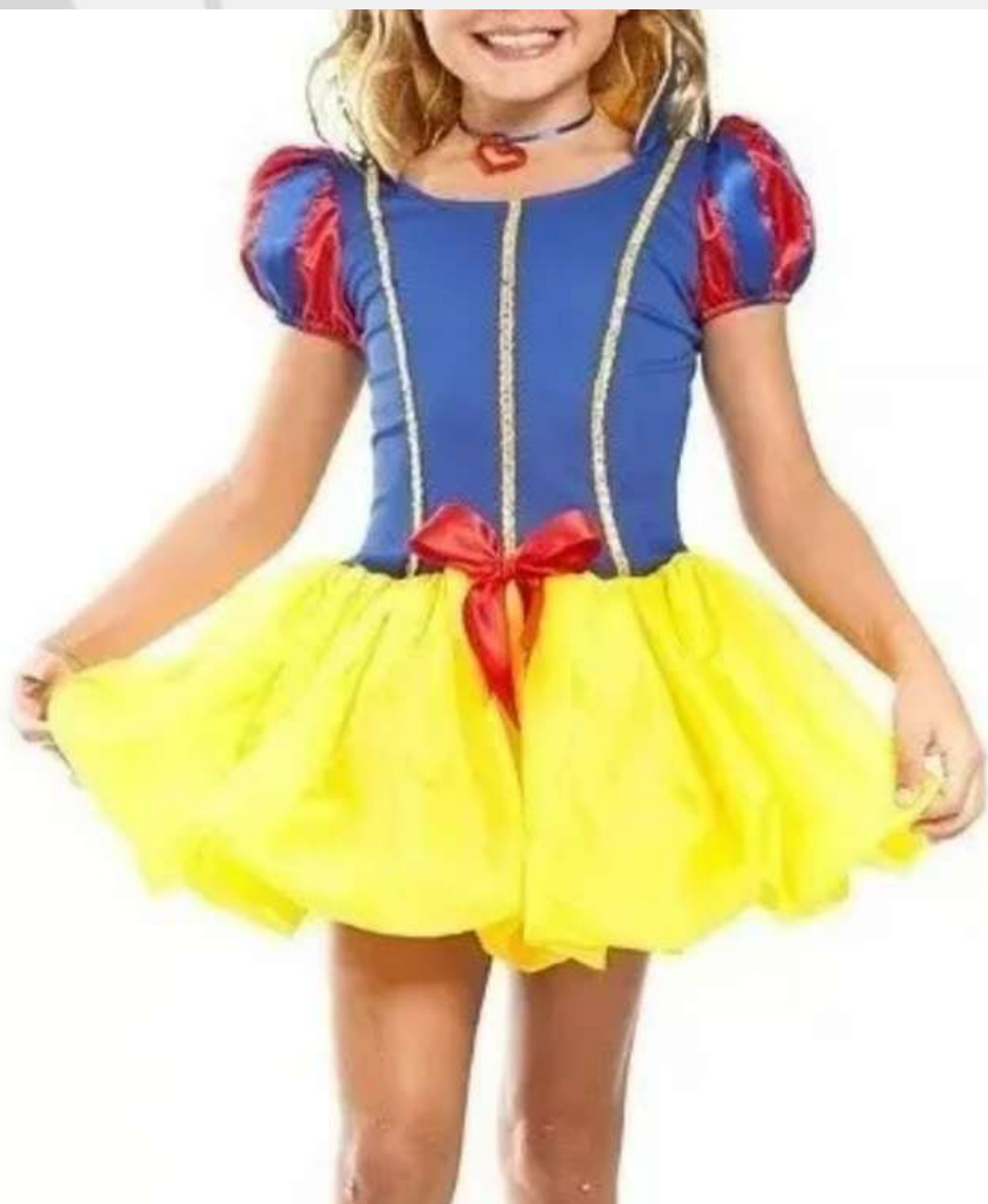
Fantasia Branca De Neve Infantil (2 aos 10 anos)