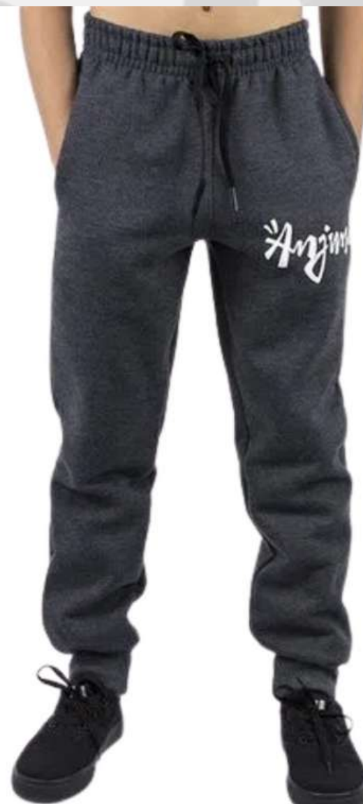
Calça Moletinho com Bolso (1 aos 14 anos)