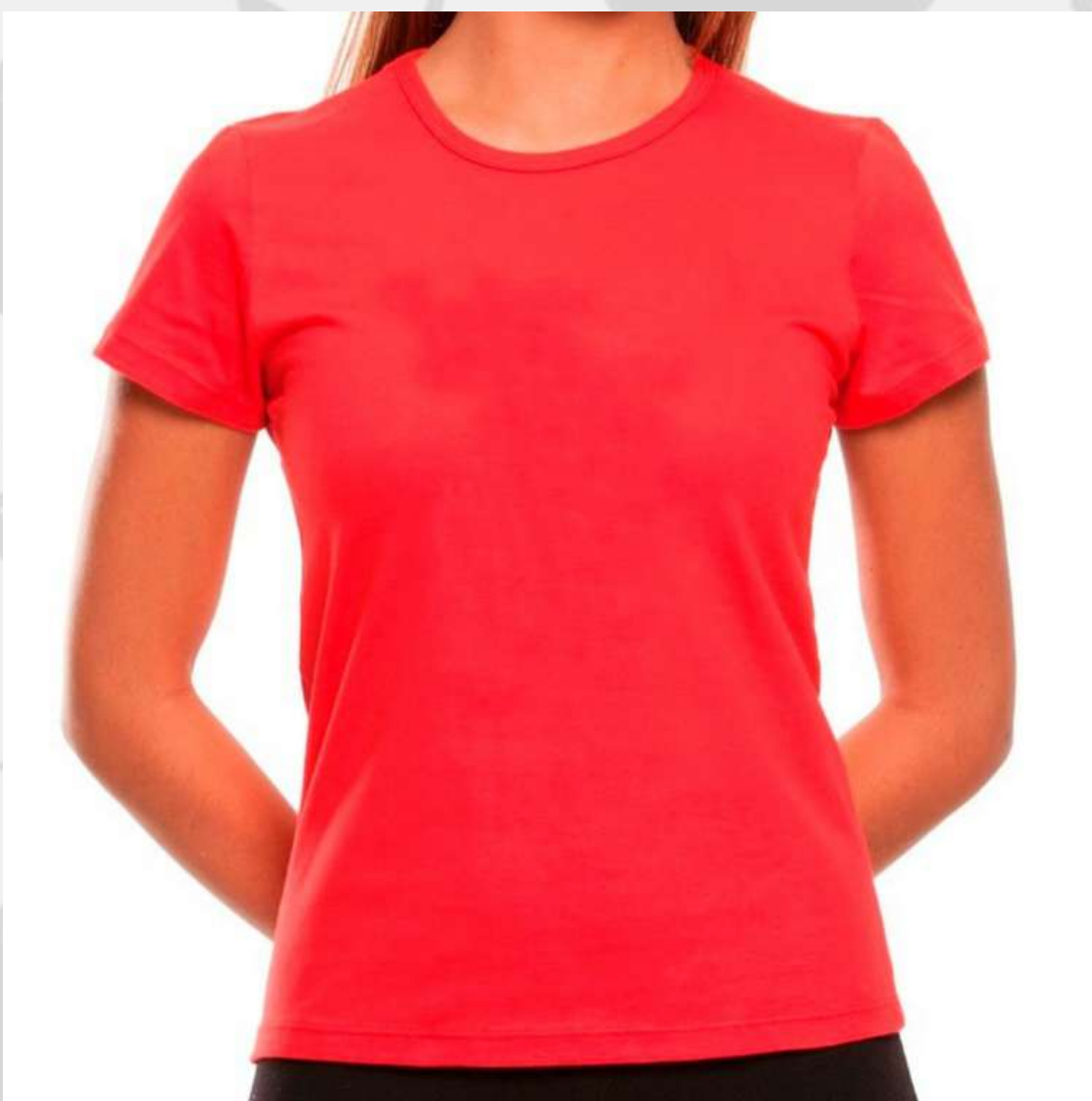
Baby Look Tradicional (2 aos 16 anos)