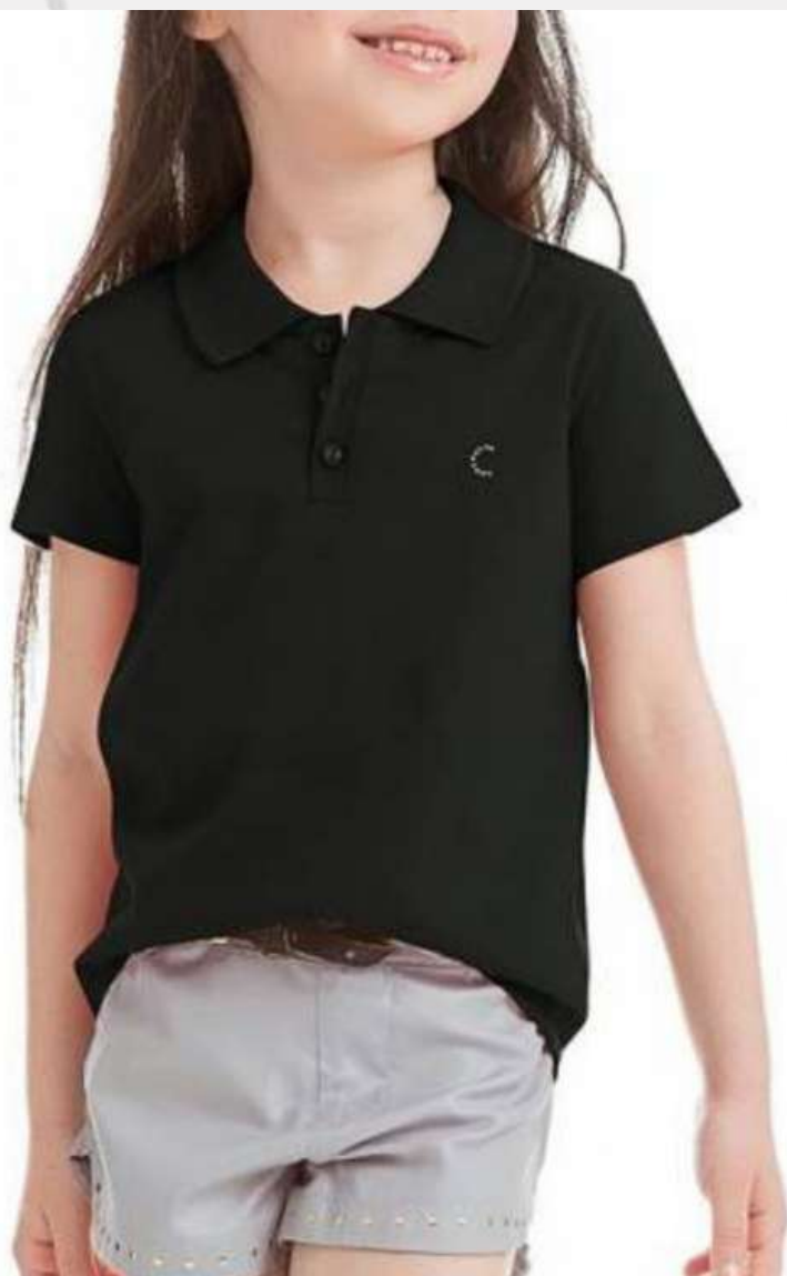
Baby look Gola Polo Tradicional (2 aos 16 anos)