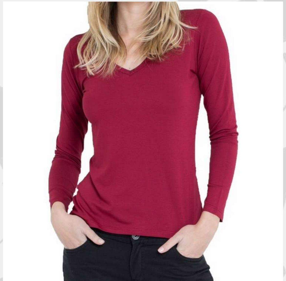
Baby Look Tradicional Gola V Manga Longa (2 aos 16 anos)