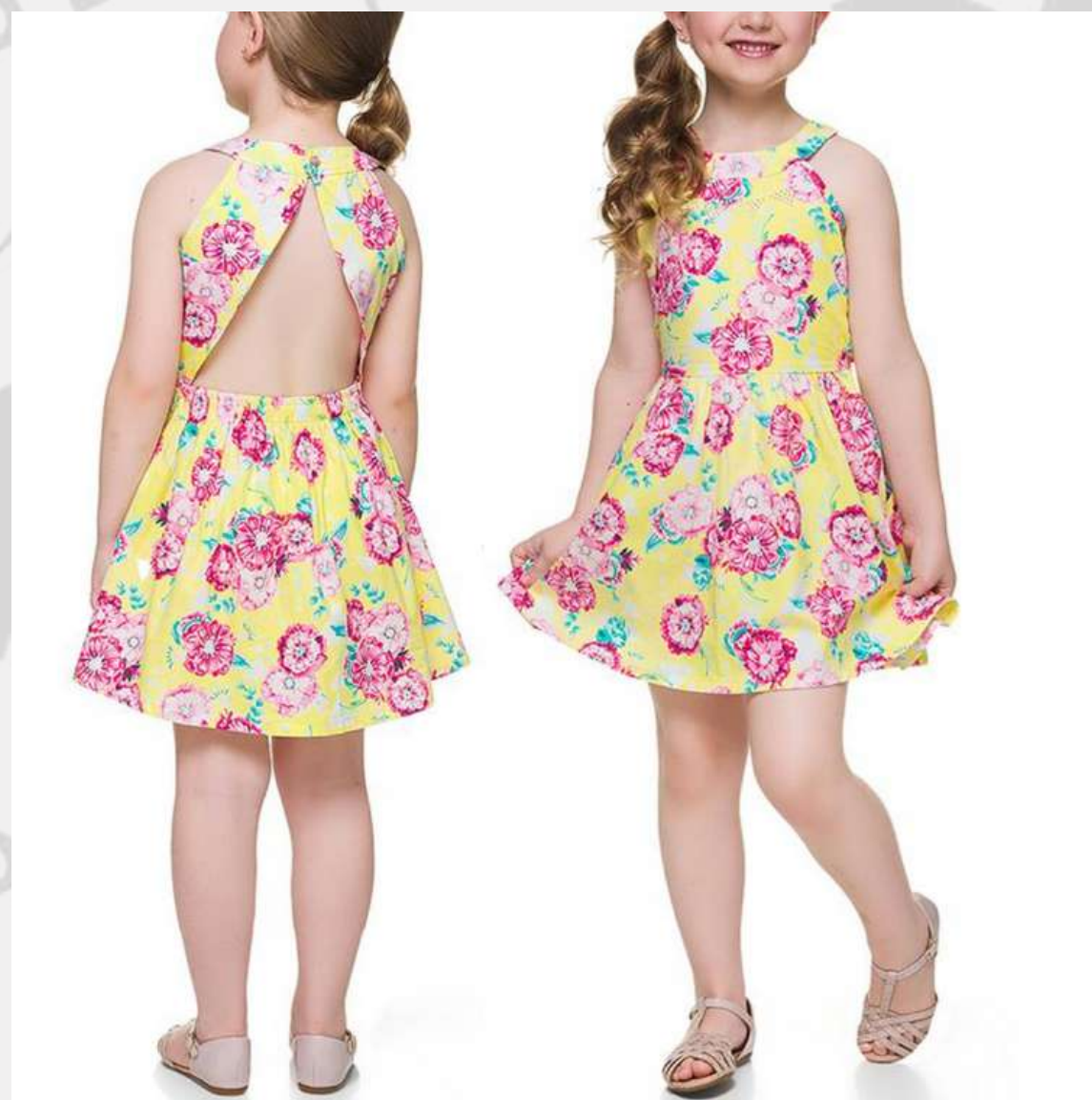
Vestido Infantil Floral (6 aos 12 anos)