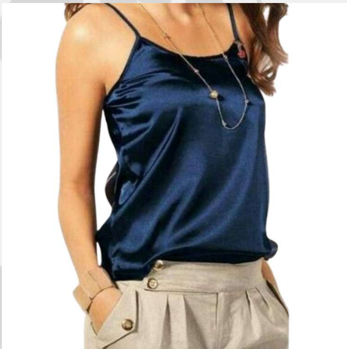
Blusinha com Alça (2 aos 16 anos)