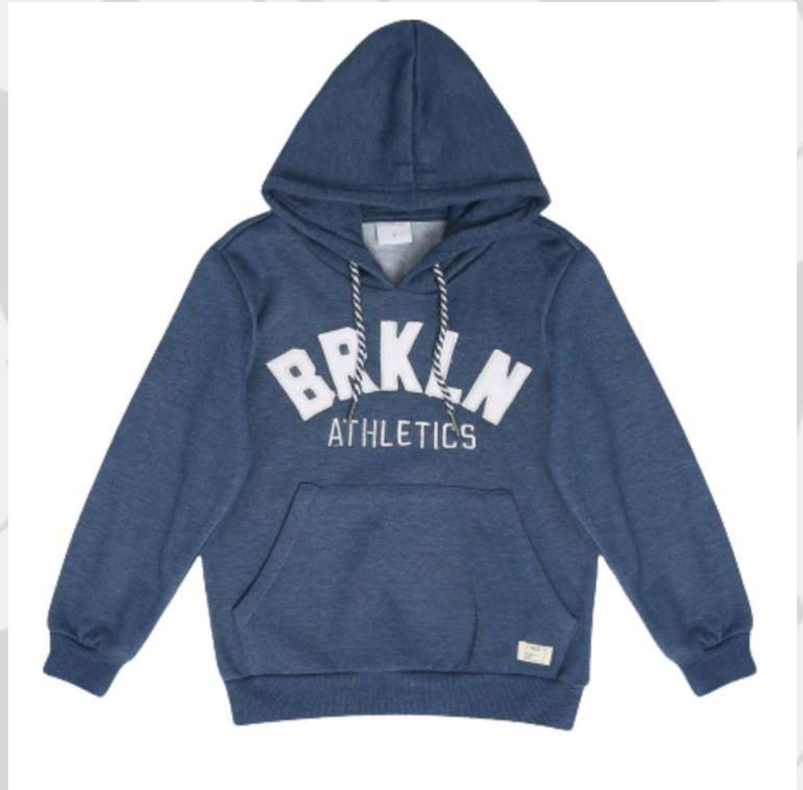
Blusa Moletom Infantil (1 aos 14 anos)