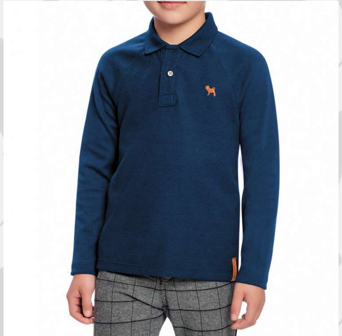
Polo Raglan Manga Longa (2 a 16 anos)