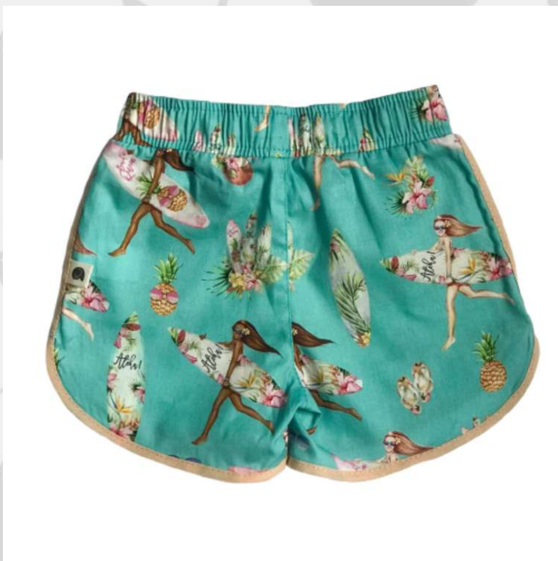
Short Surf Infantil Feminino Boleado (2 a 16 anos)