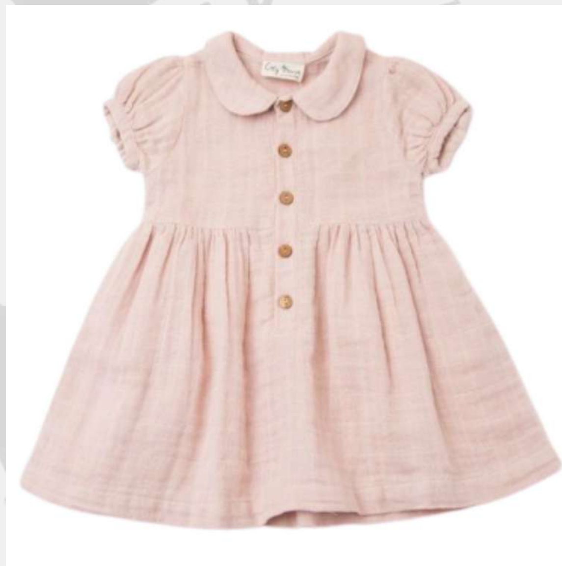
Vestido Evêse (2 aos 6 anos)