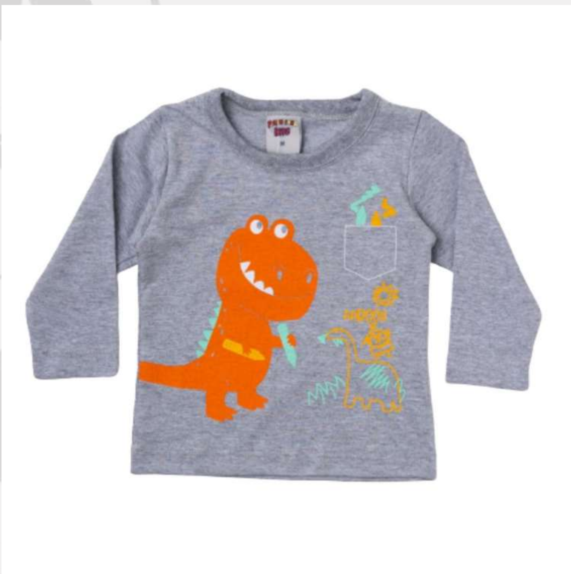
Blusa Moletom Bebê Unisex Básica (RN ao GG)