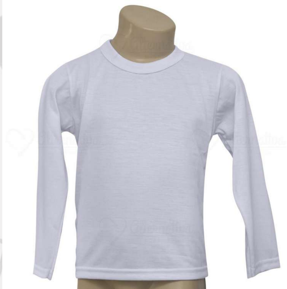
Camiseta Tradicional Manga Longa (2 aos 16 anos)