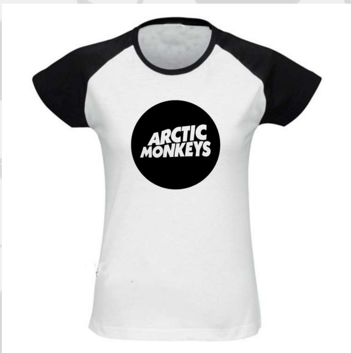
Baby Look Raglan (2 aos 16 anos)