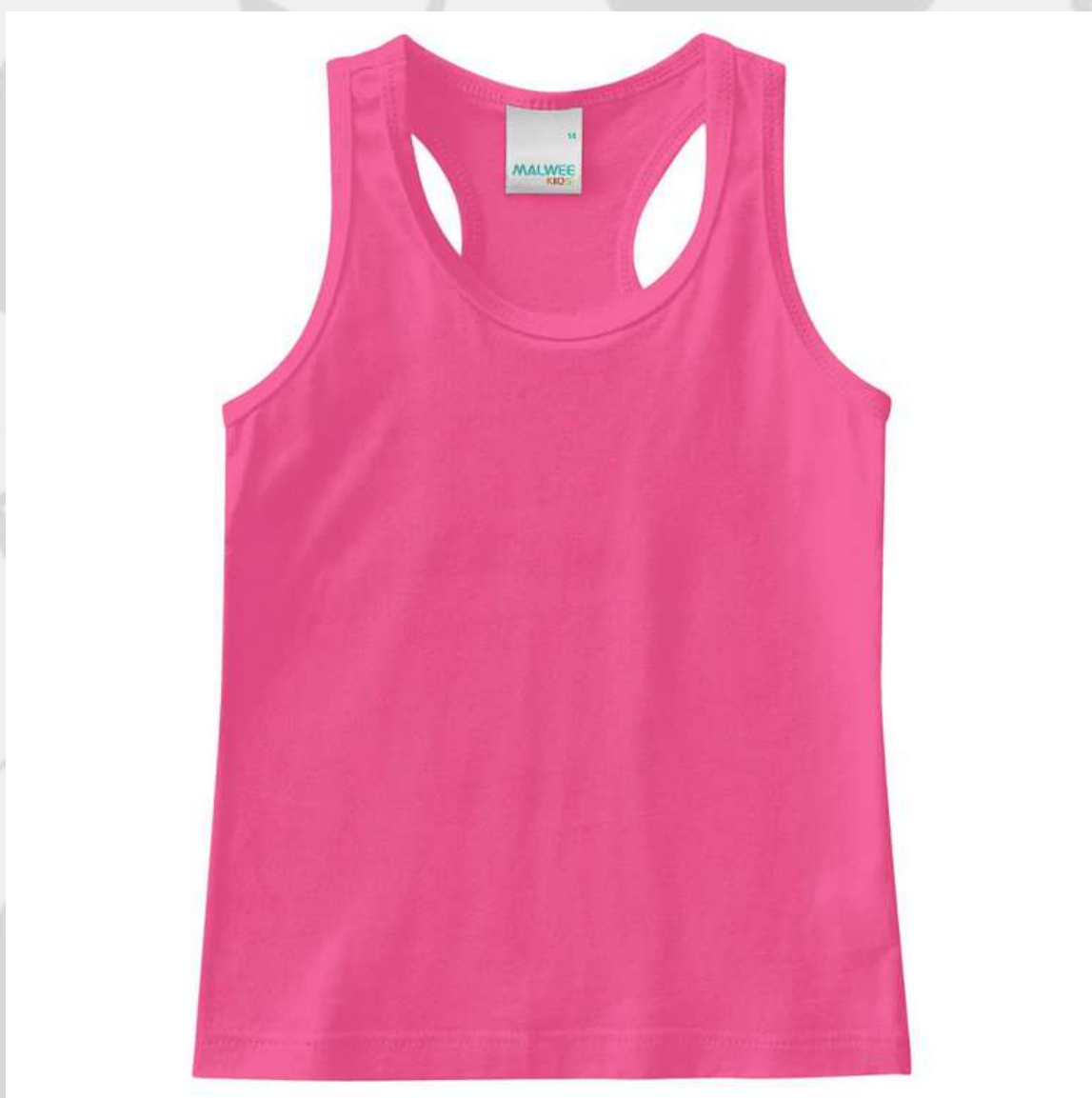
Regata Costa Nadador Feminina Infantil (2 a 16 anos)