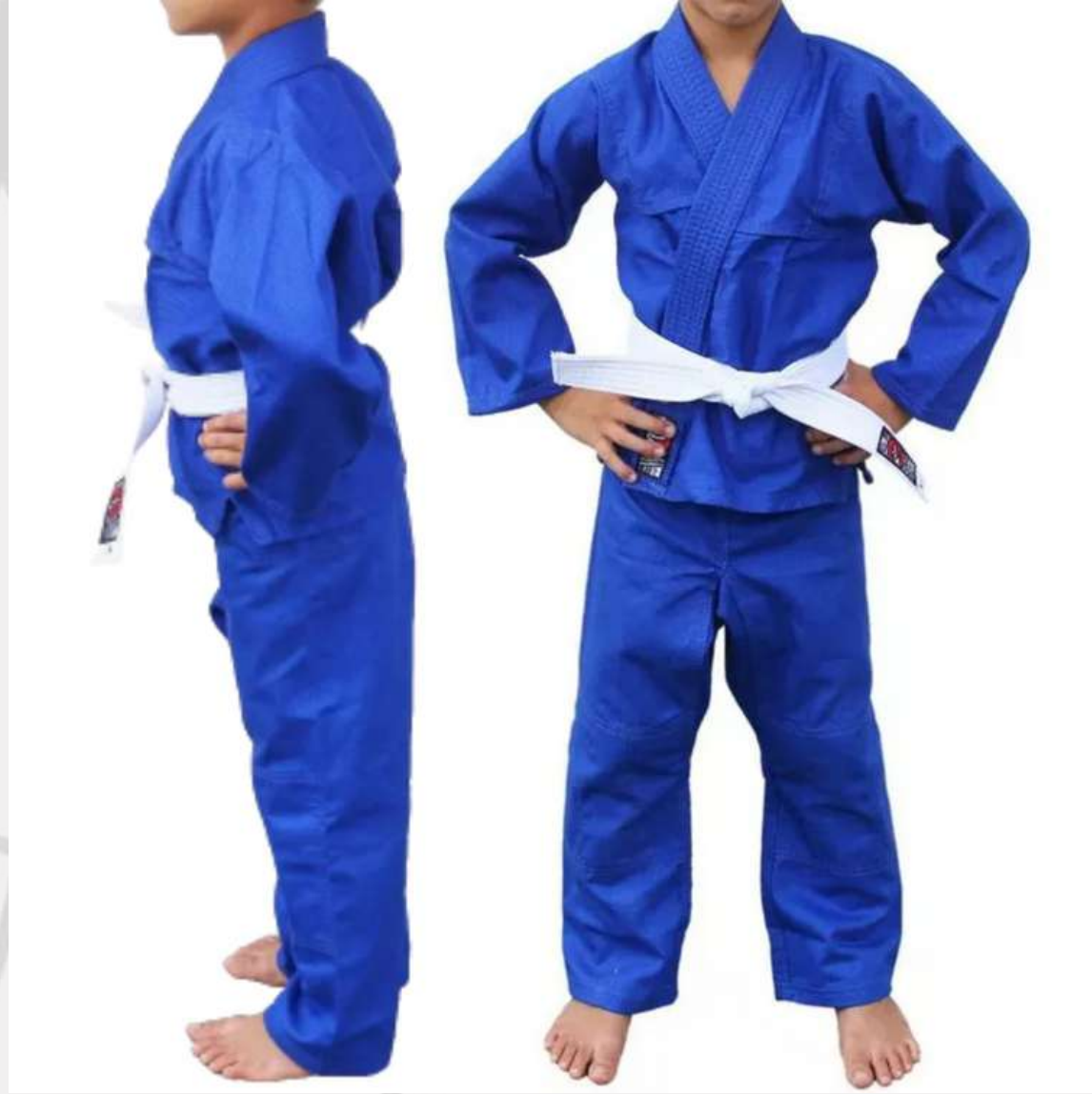
Kimono Infantil (6 aos 16 anos)