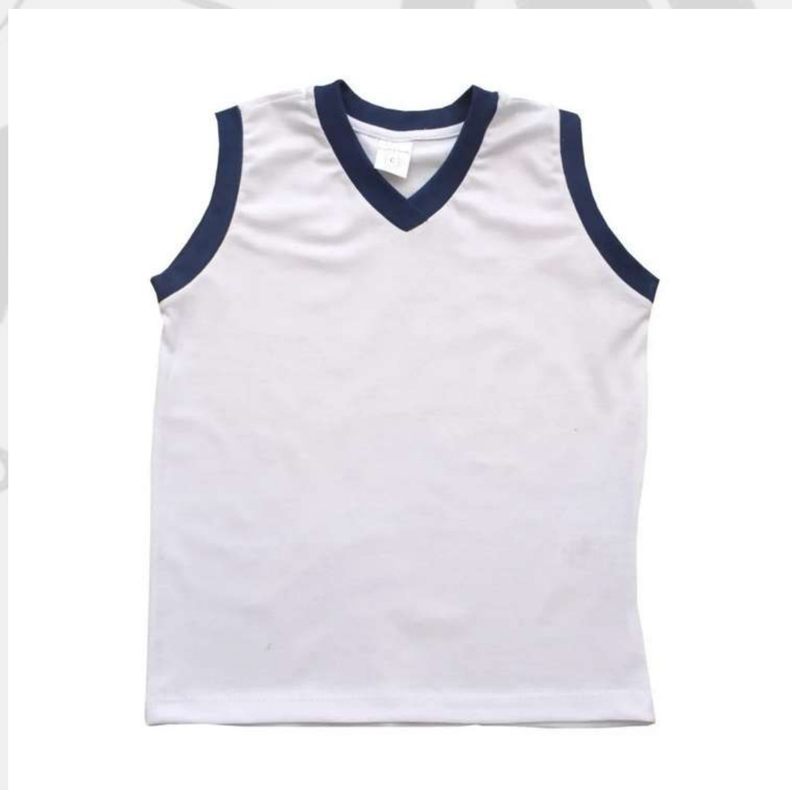
Regata Escolar Infantil (2 a 16 anos)