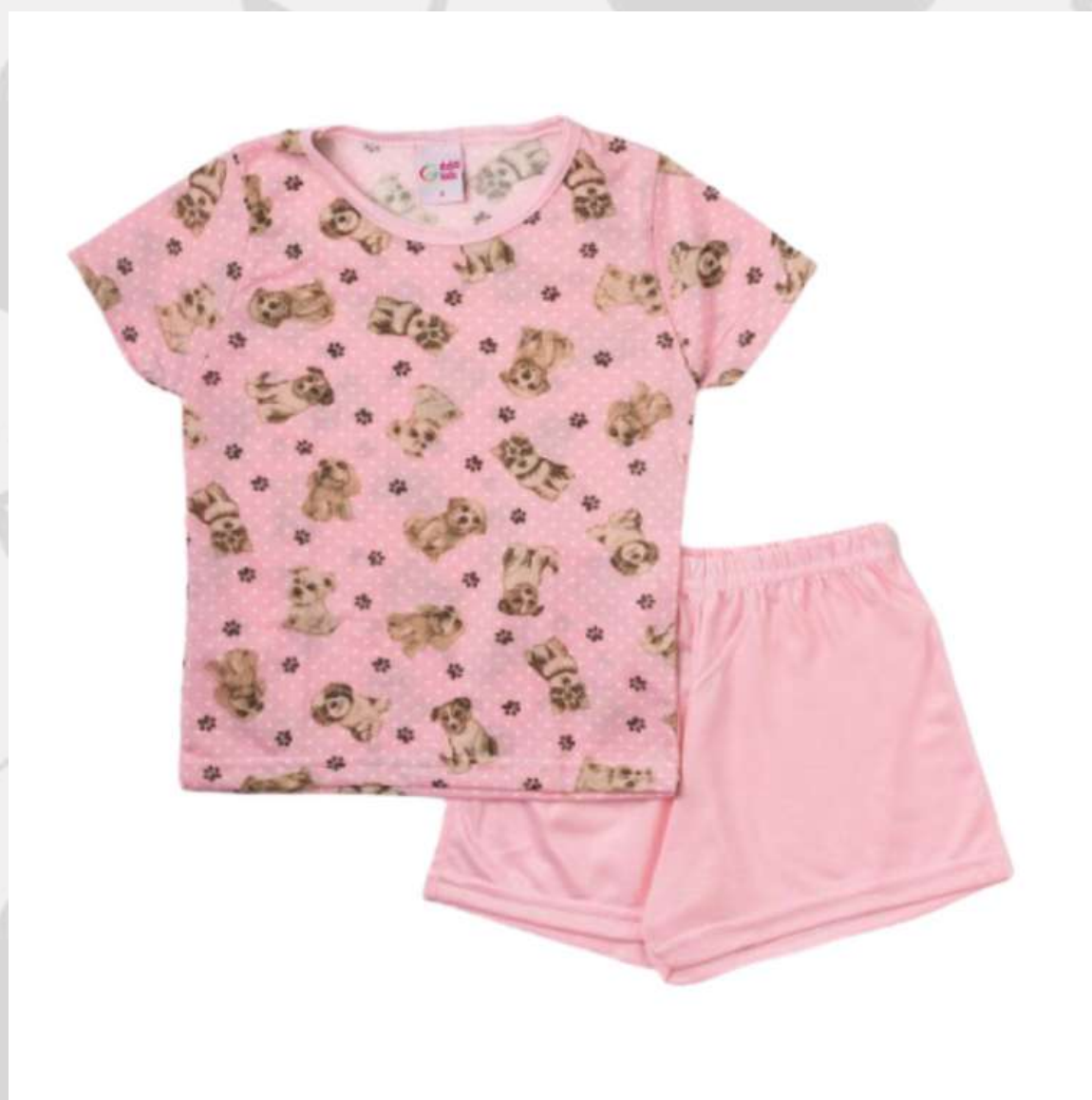
Pijama Infantil Verão Feminino (1 aos 16 anos)