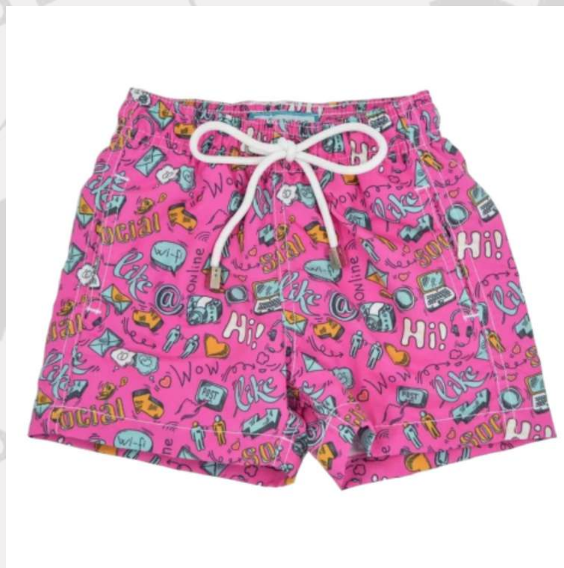
Short Surf Infantil Feminino Reto (2 a 16 anos)