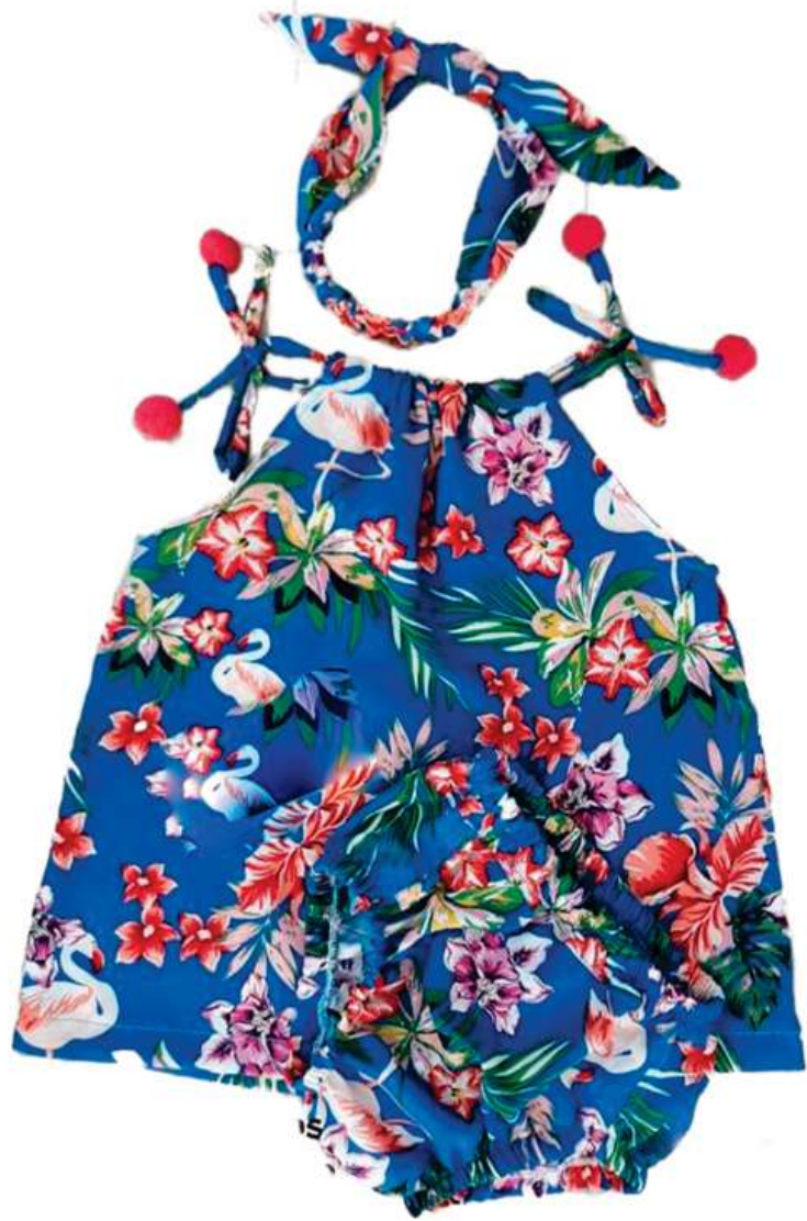
Conjuntinho Bata e Tiara Com Calcinha (1 aos 8 anos)