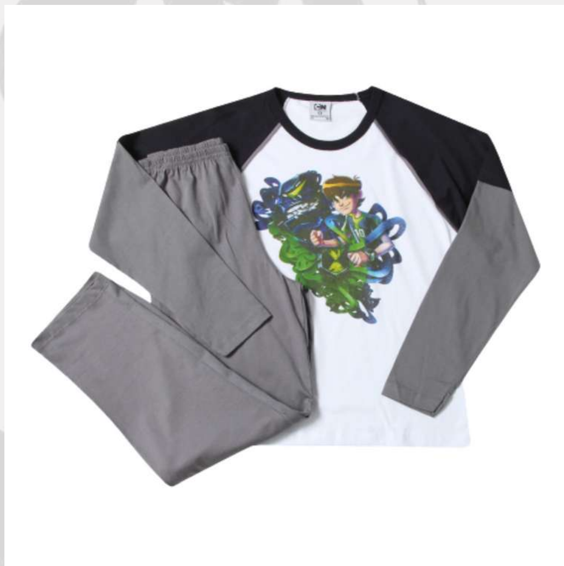
Conjunto Pijama Raglan Inverno (2 aos 16 anos)