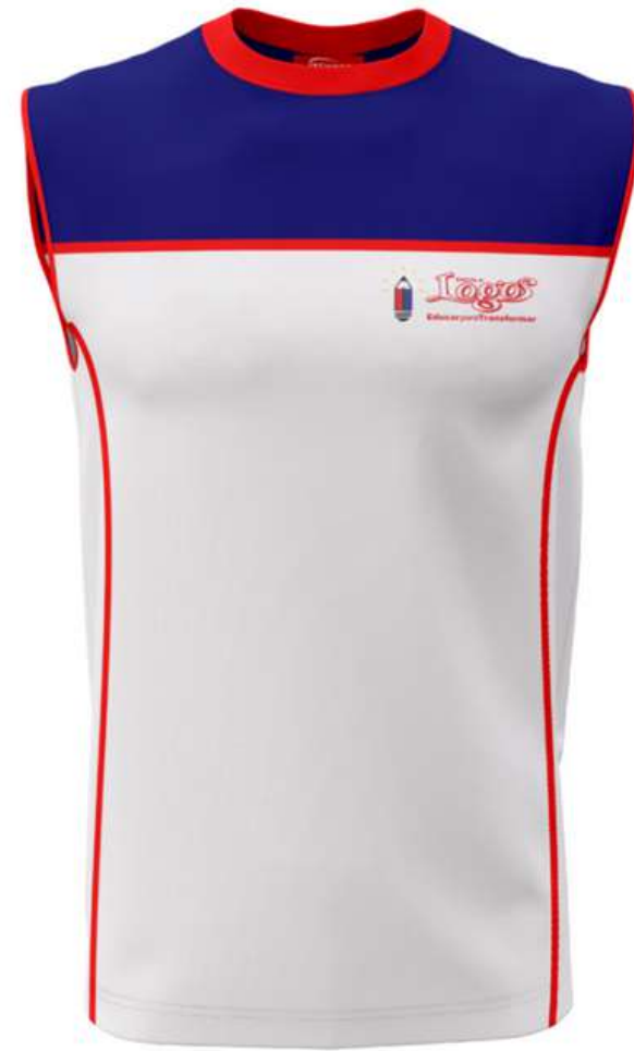
Regata Escolar com Recorte no Ombro (2 a 16 anos)