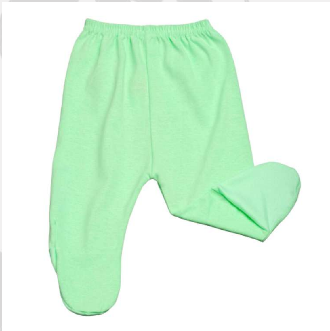
Calça Mijão Bebê (RN ao GG)