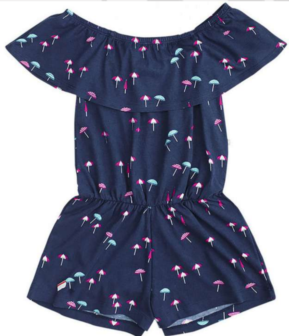
Macaquinho Com Babado (1 aos 8 anos)