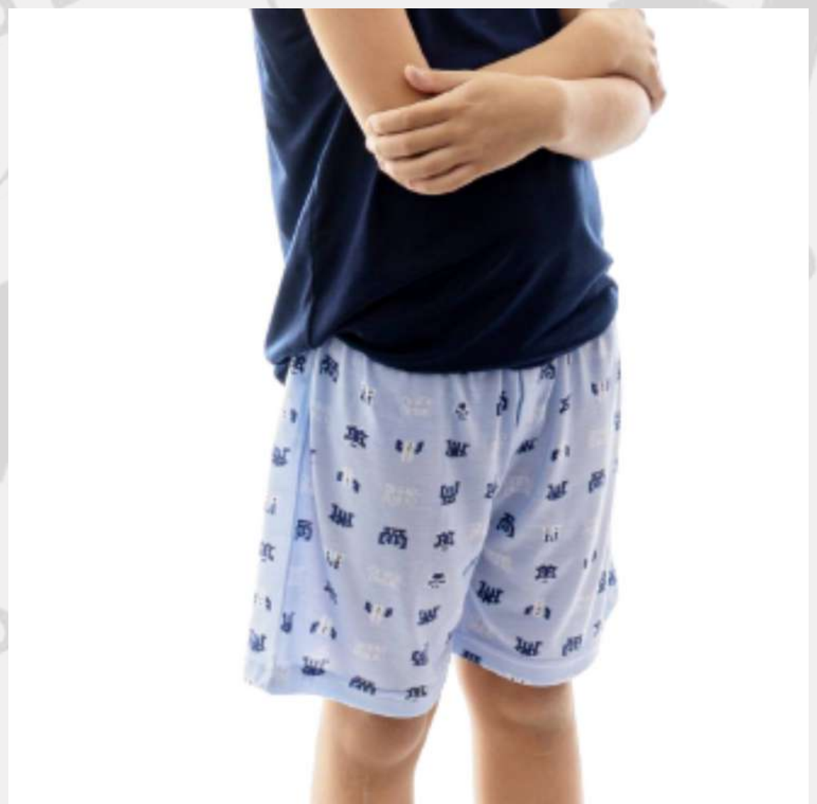
Short Malha Masculino Infantil (2 aos 16 anos)