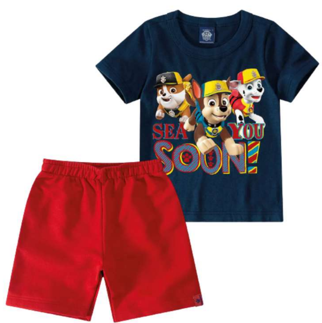
Conjuntinho Verão Masculino Infantil (1 aos 12 anos)