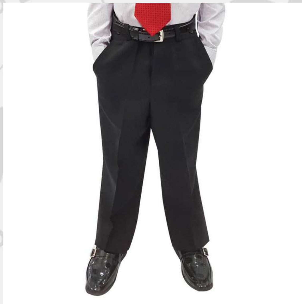
Calça Social Infantil (2 aos 16 anos)