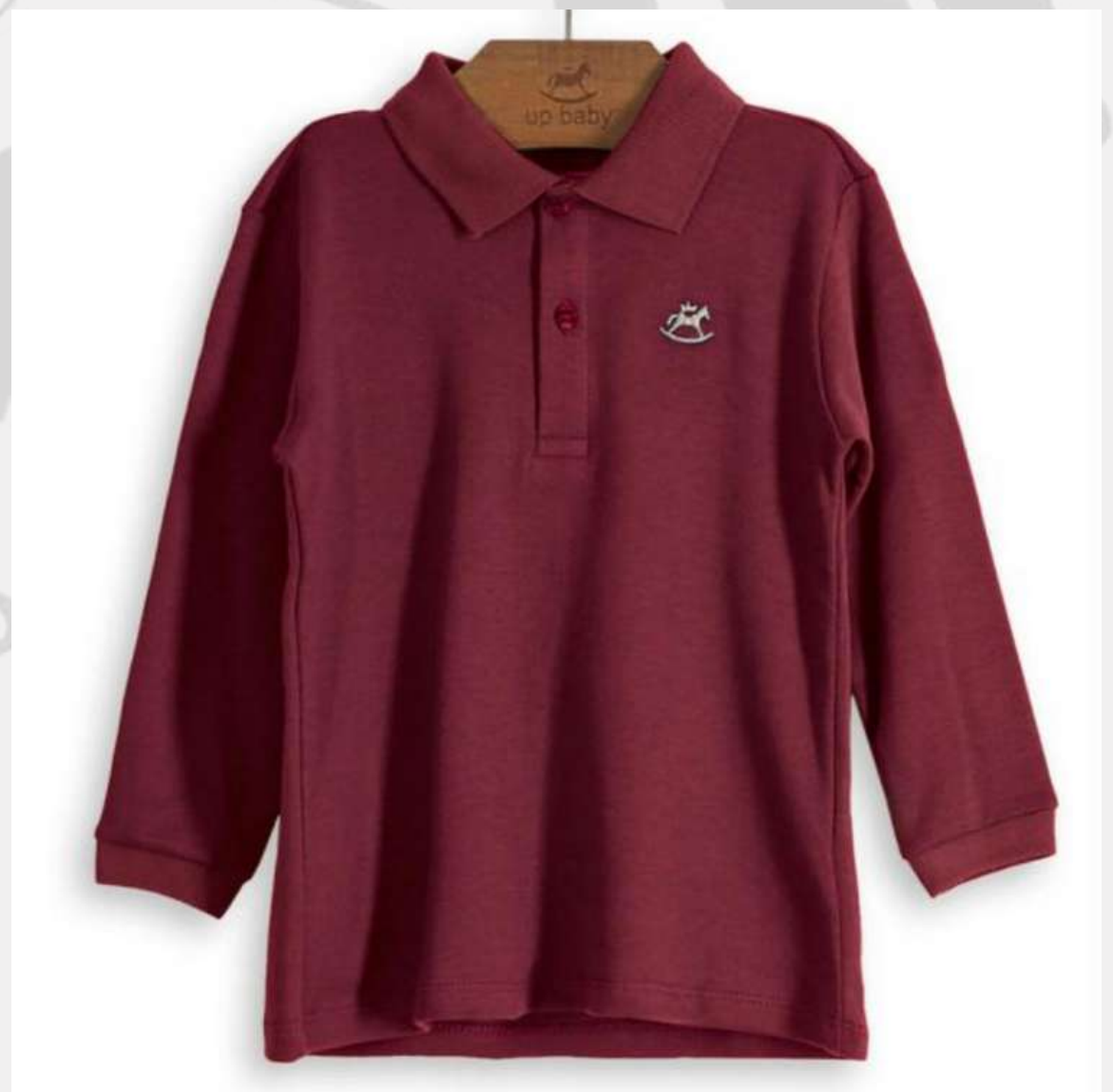
Polo Tradicional Manga Longa (2 a 16 anos)