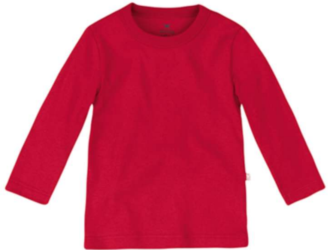
Blusa Moletom Bebê Unisex Básica (Modelagem Maior RN ao GG)