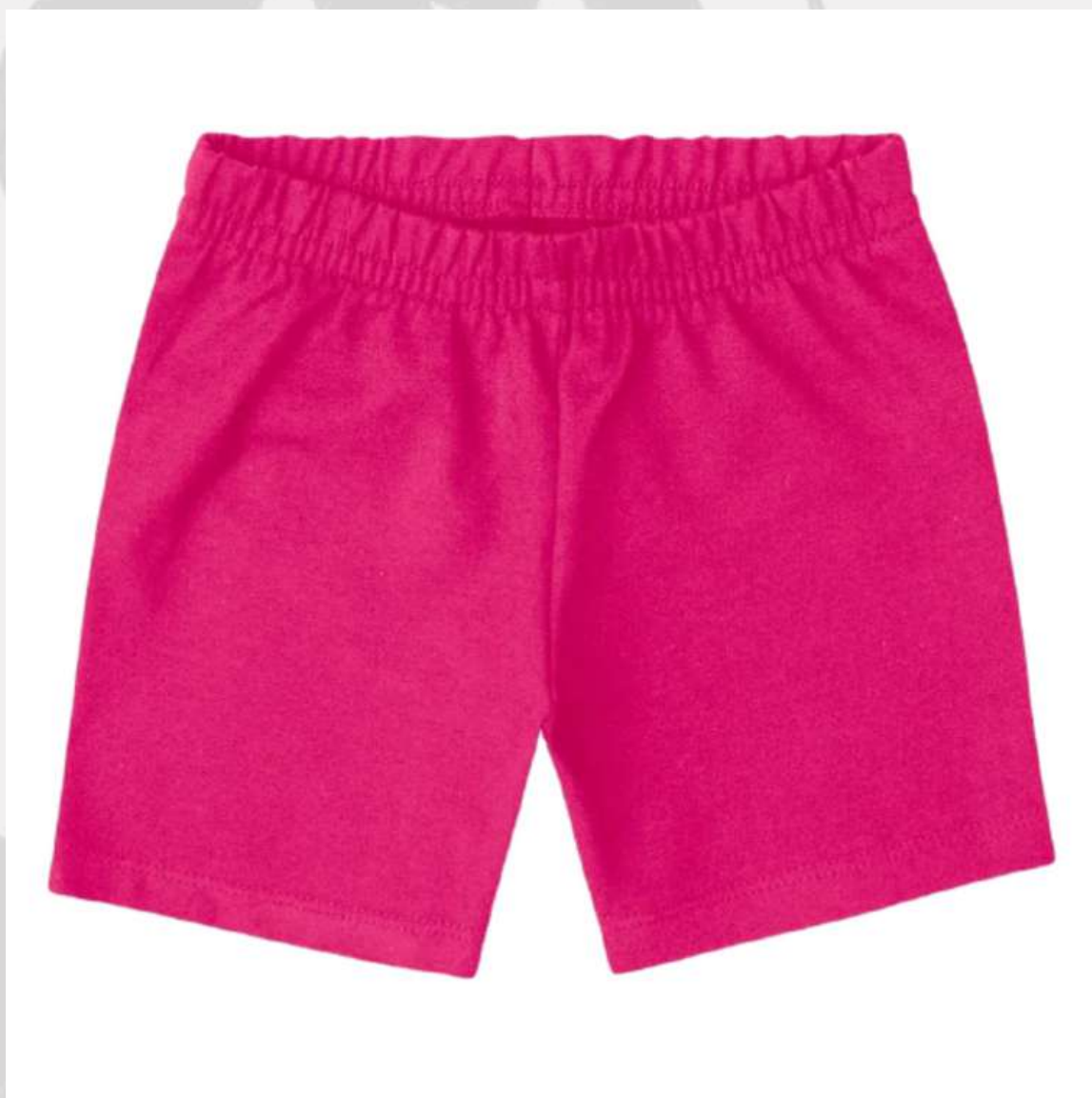
Short Infantil Feminino Curto (1 aos 16 anos)