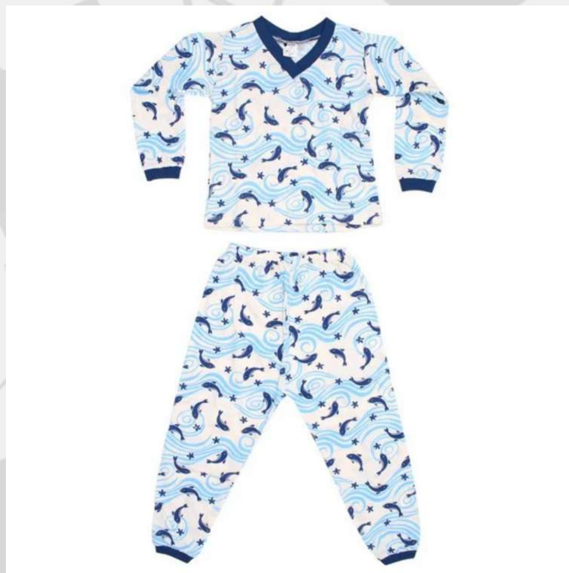
Conjunto Pijama Unisex Inverno (1 aos 14 anos)