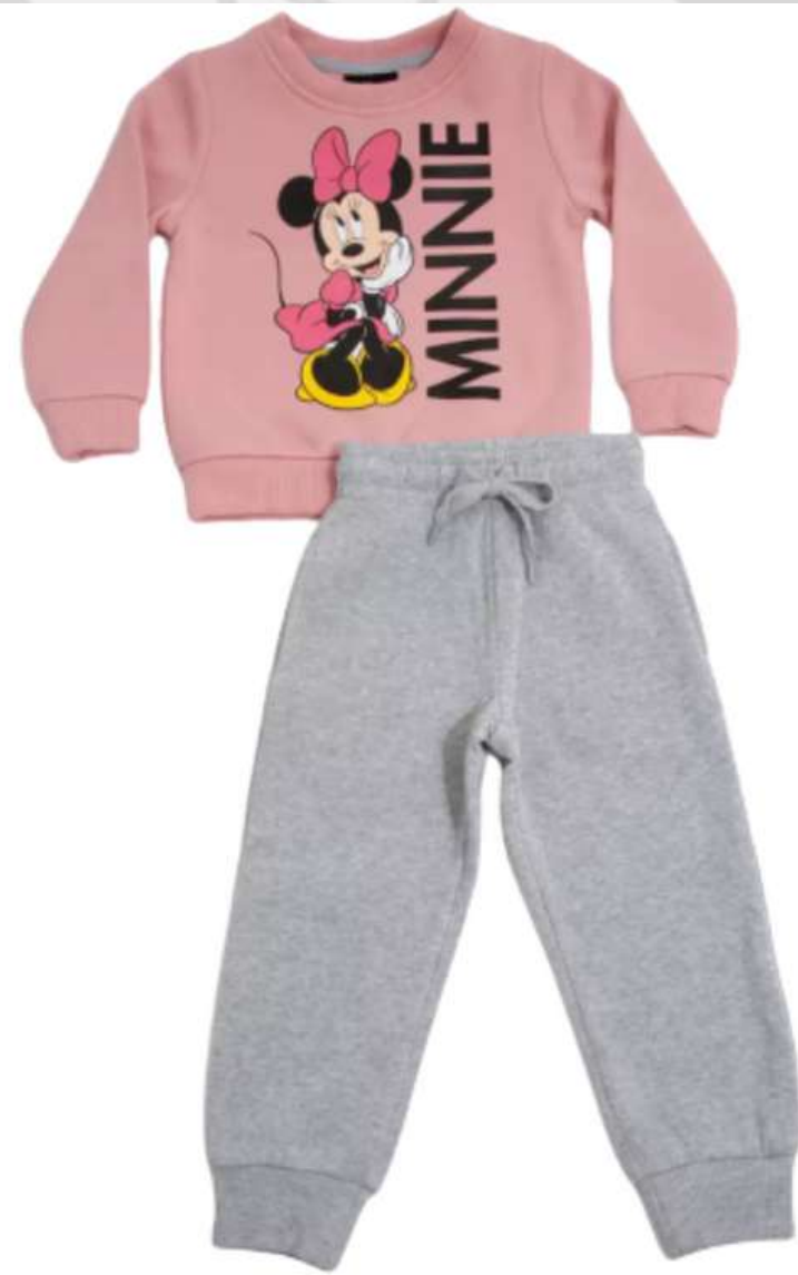
Conjuntinho Moletom Infantil (1 aos 14 anos)