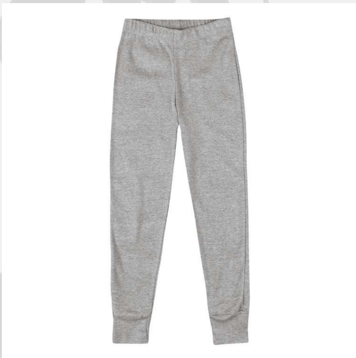
Calça Moletom sem Bolso (1 aos 14 anos)