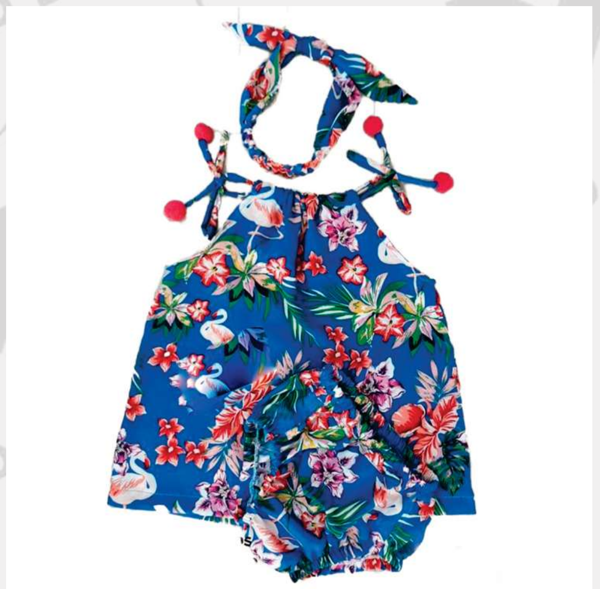
Conjuntinho Bata e Tiara Com Calcinha (P ao GG)