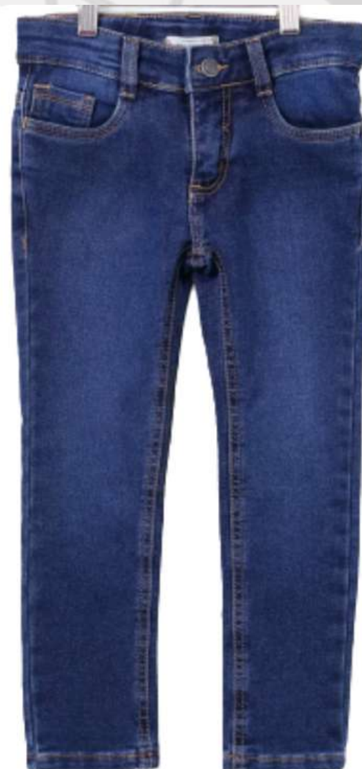
Calça Jeans Infantil (1 aos 16 anos)