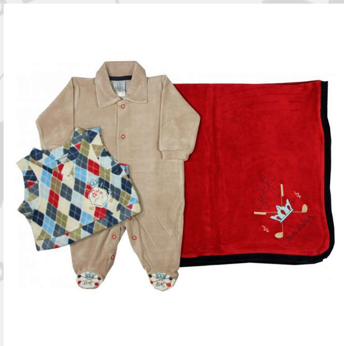
Kit Macacão, Manta e Colete (P ao GG)