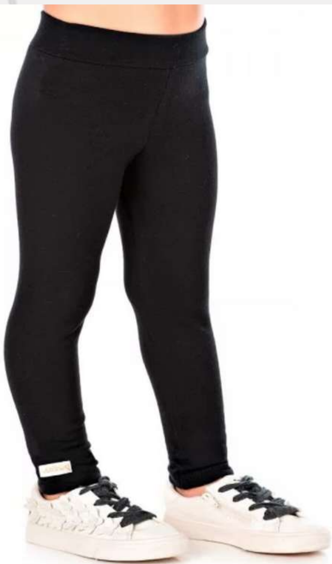
Calça Legging Básica (2 aos 14 anos)