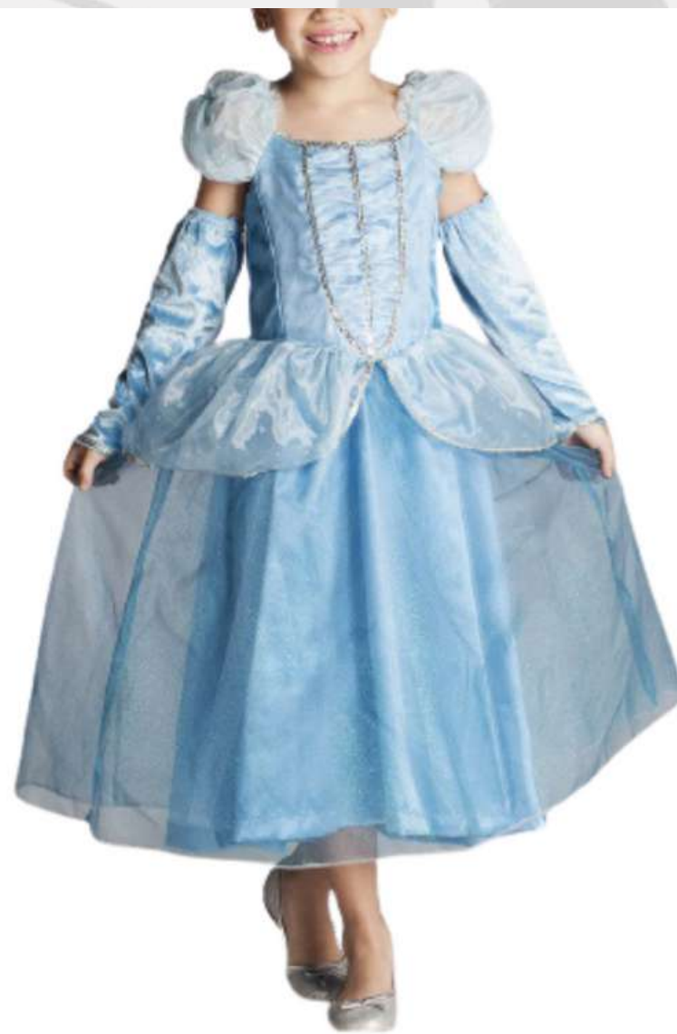
Fantasia Vestido Cinderela (2 Aos 12 anos)