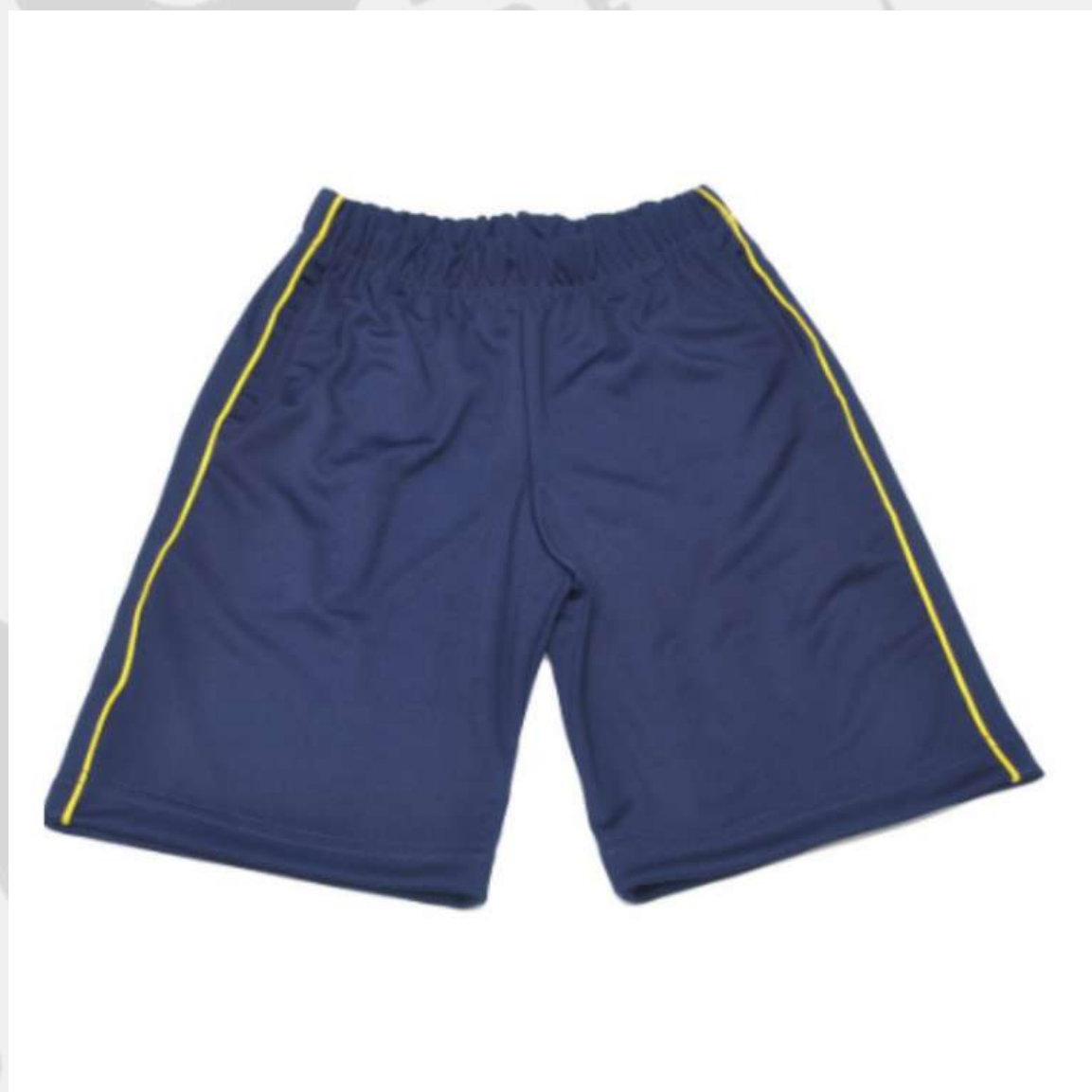
Bermuda Escolar Infantil (2 a 16 anos)