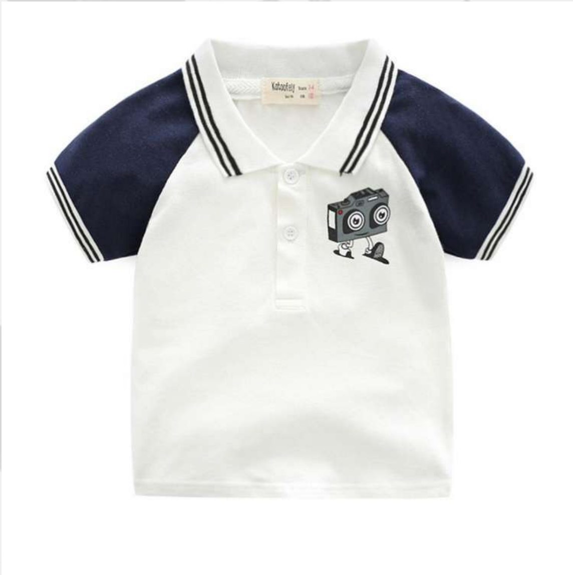
Polo Raglan Manga Curta (2 a 16 anos)