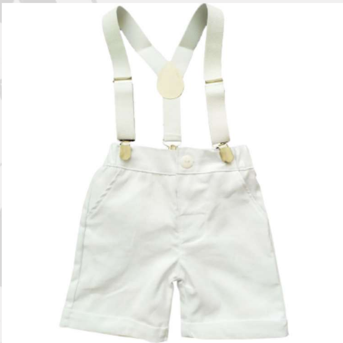
Bermuda com Suspensório Infantil (1 aos 8 anos)

CONFIRA ALGUNS MODELOS BERMUDAS e SHORTS