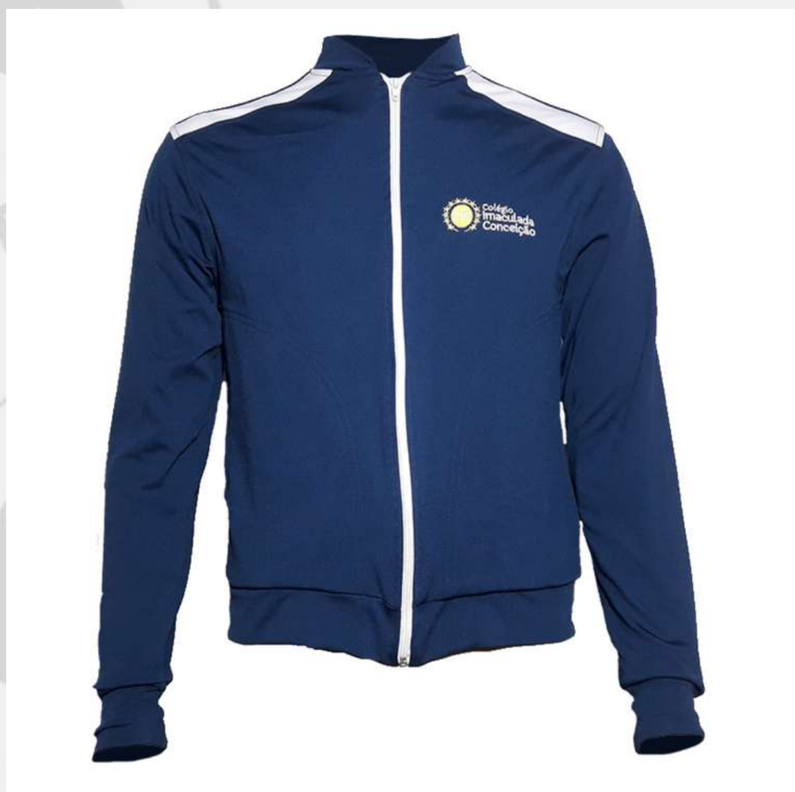
Jaqueta Escolar Infantil (4 aos 16 anos)