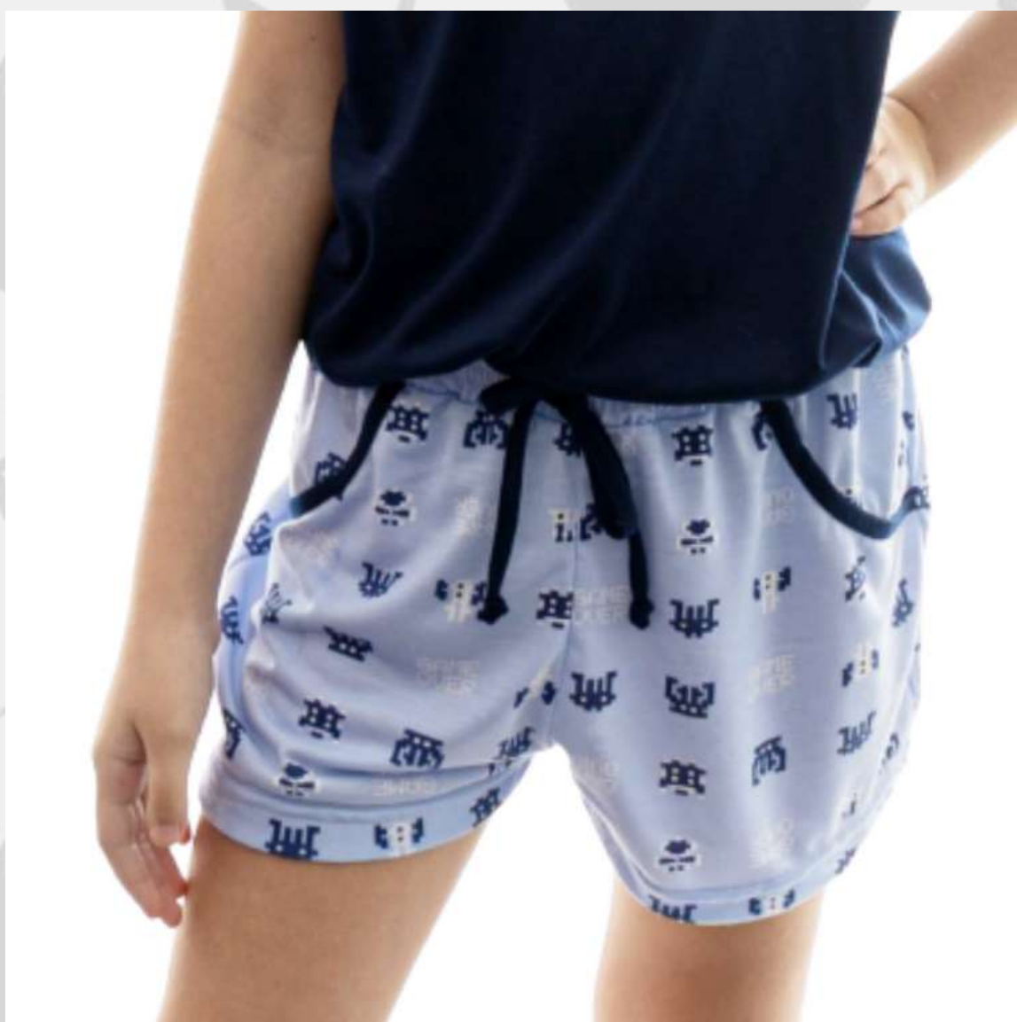
Short Malha Feminino Infantil (2 aos 16 anos)