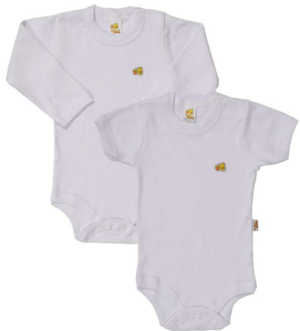
Body Bebê Manga Longa e Curta (RN ao GG)