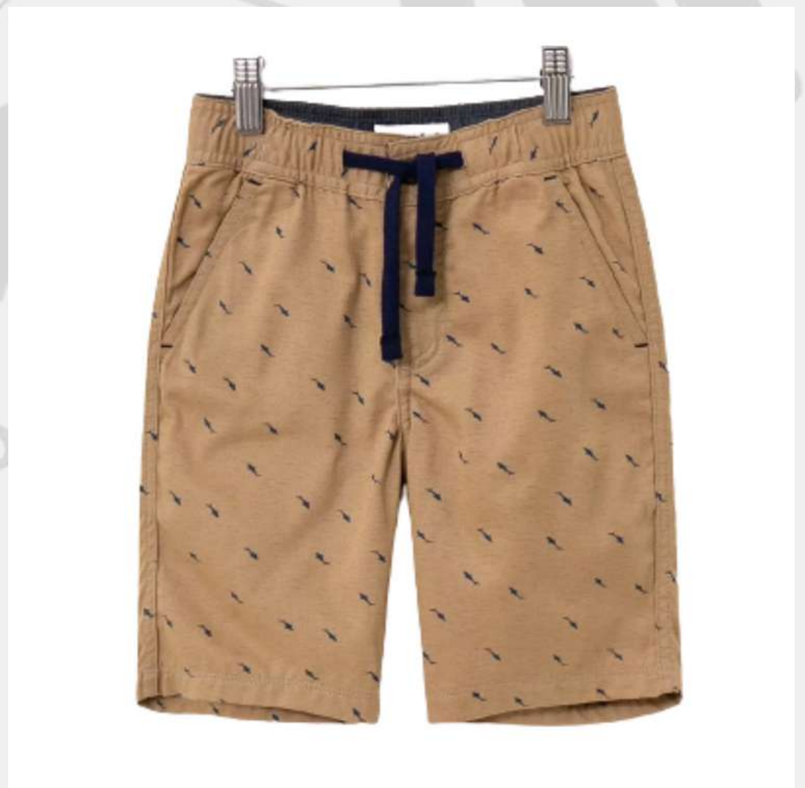
Bermuda Infantil Básica (2 a 16 anos)