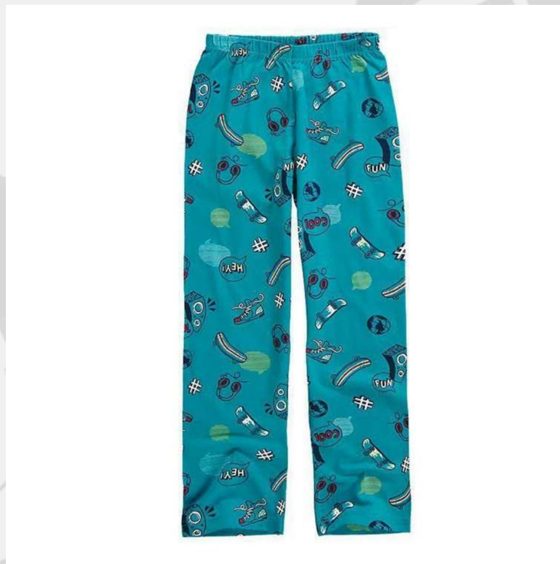
Calça Pijama Inverno (2 aos 16 anos)