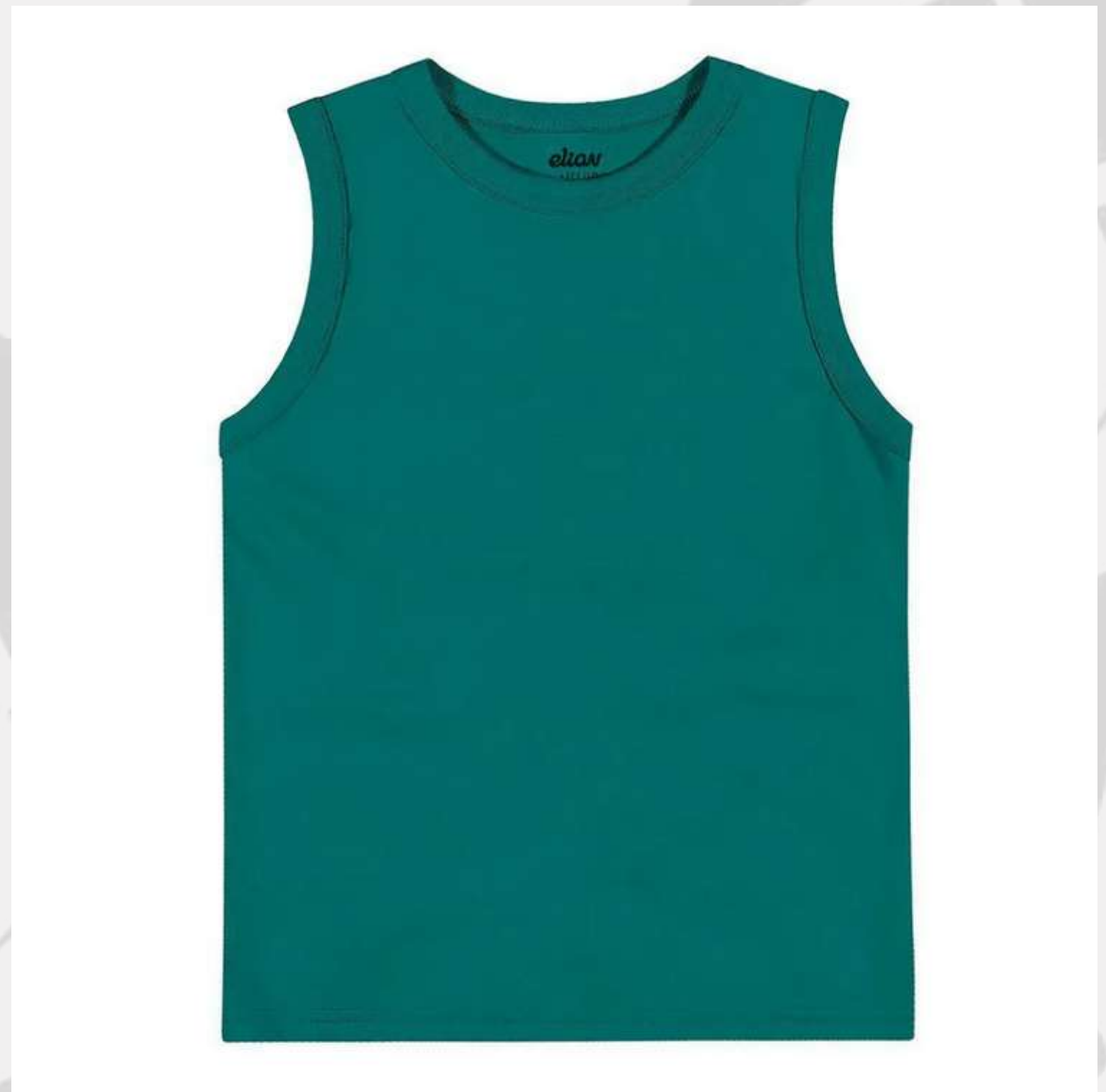
Regata Básica Infantil (2 a 16 anos)