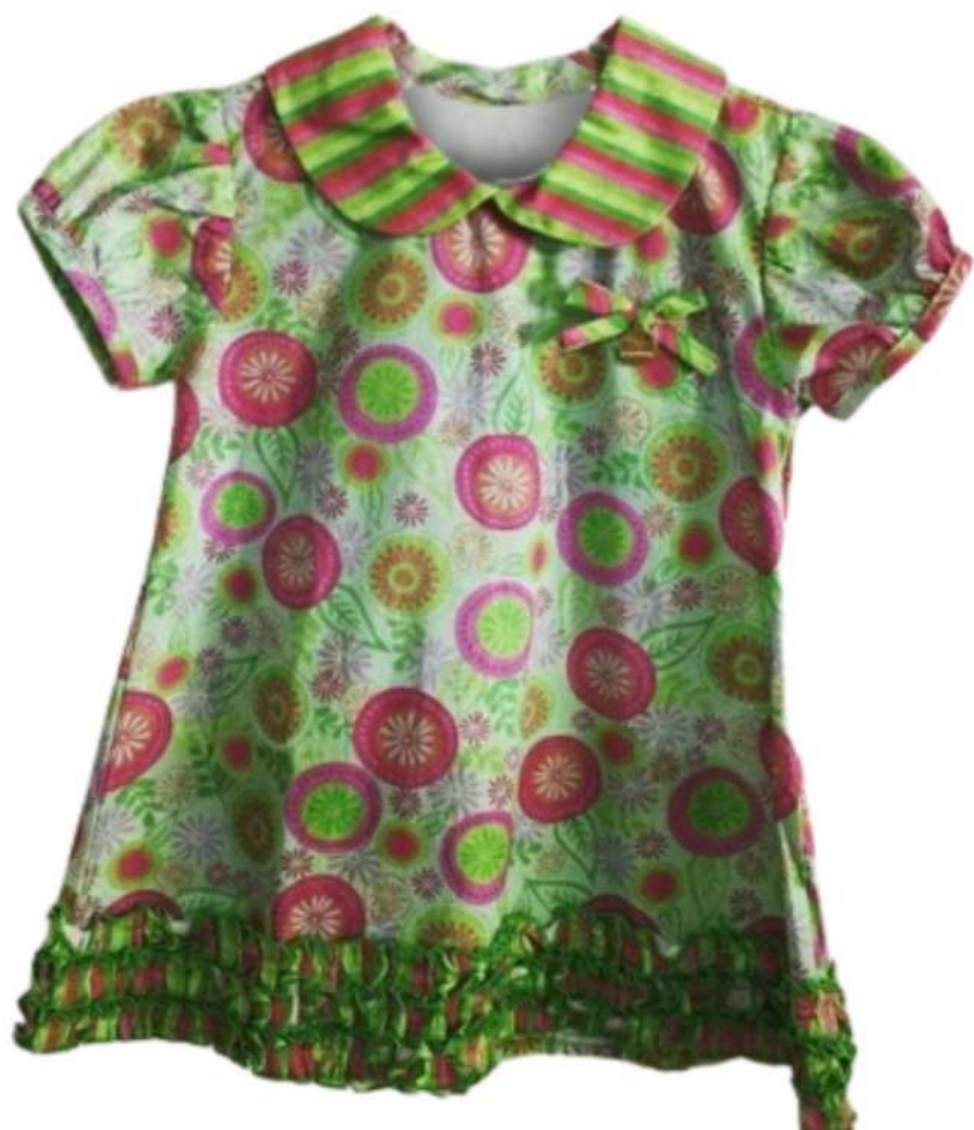
Bata Infantil (P ao GG)