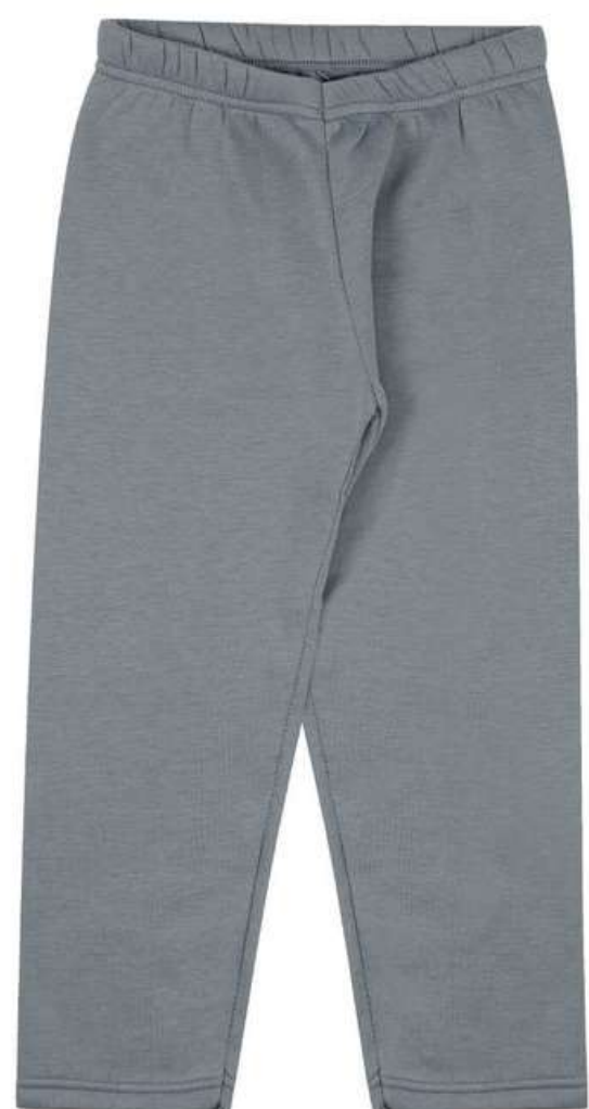
Calça Básica Infantil (2 aos 14 anos)