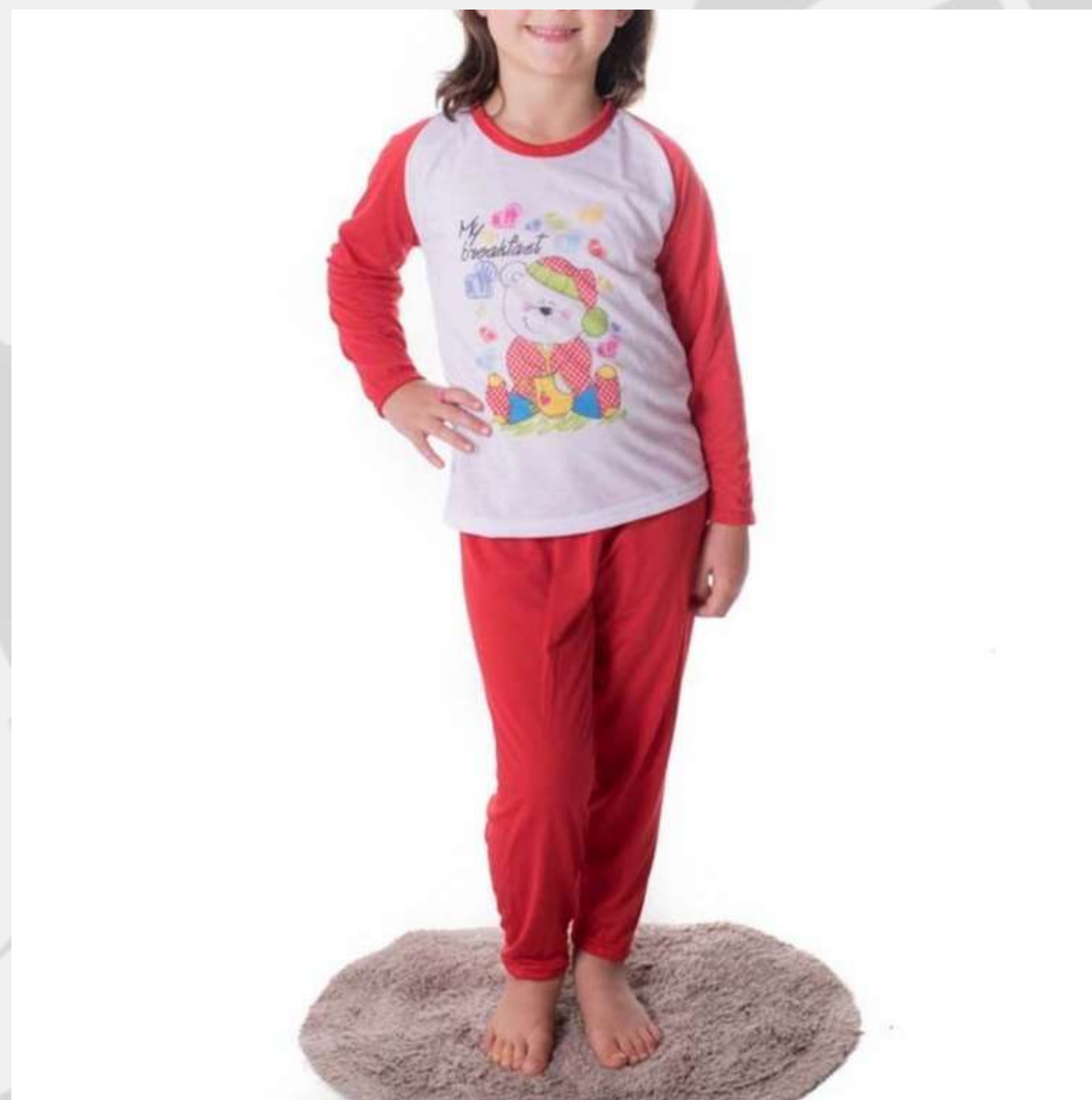
Conjunto Pijama Unisex Verão (2 aos 16 anos)