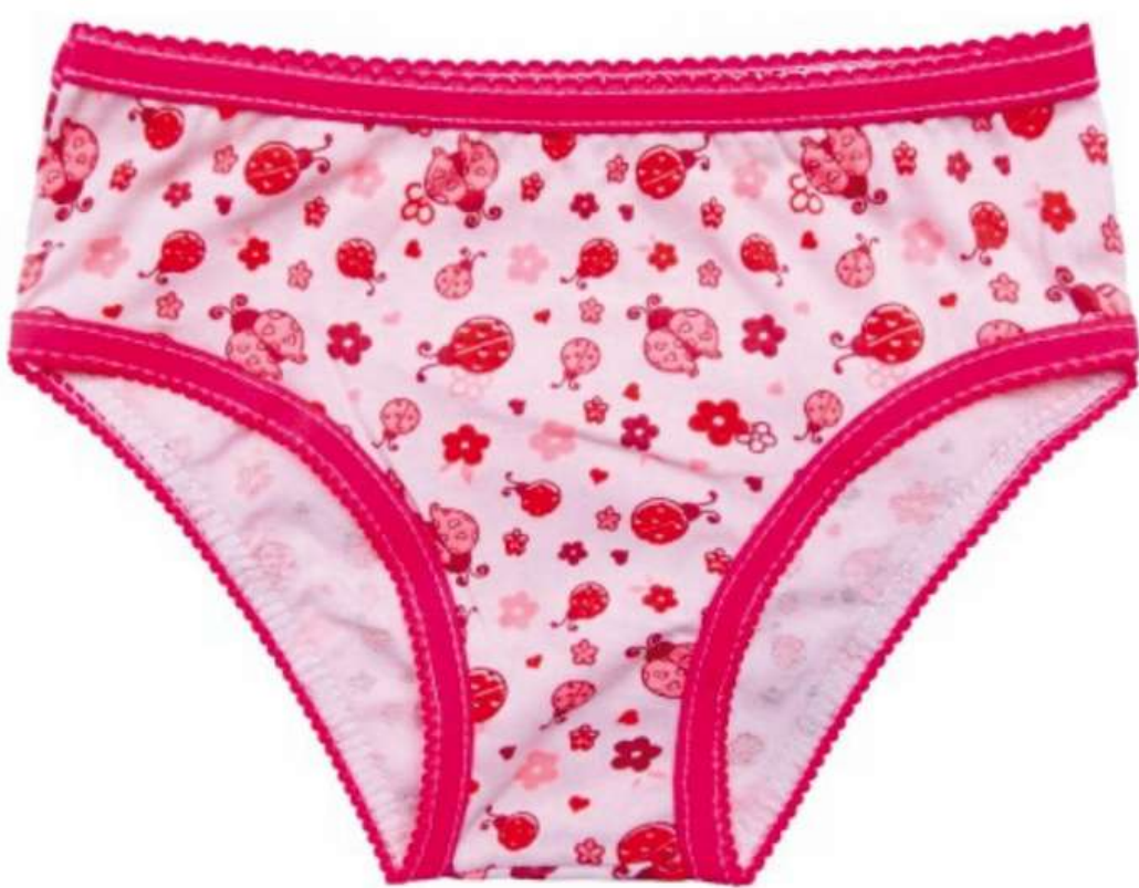
Calcinha Básica Infantil (1 aos 10 anos)