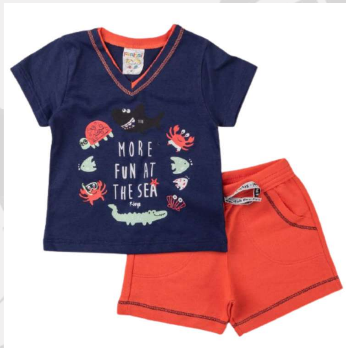
Conjuntinho Verão Masculino Bebê (P ao GG)