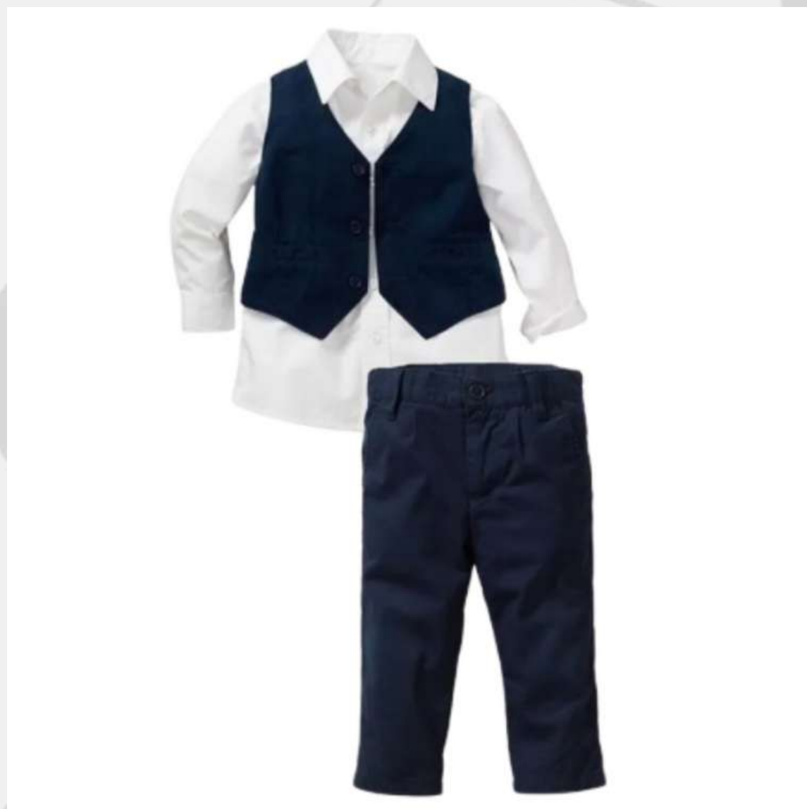
Conjuntinho Social Longo Masculino (2 aos 16 anos)