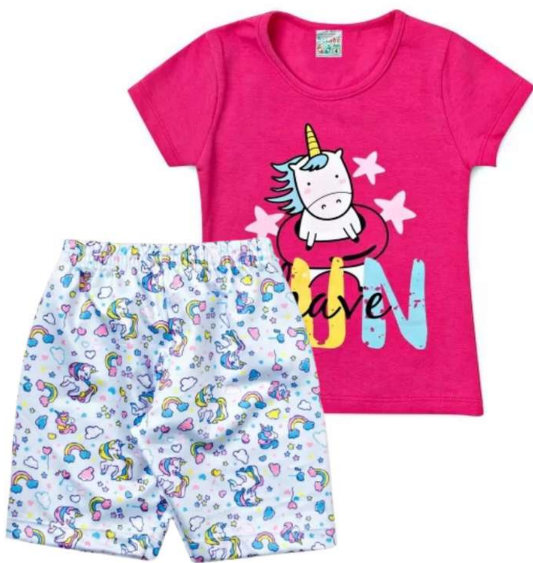
Conjuntinho Verão Feminino Infantil (1 aos 16 anos)