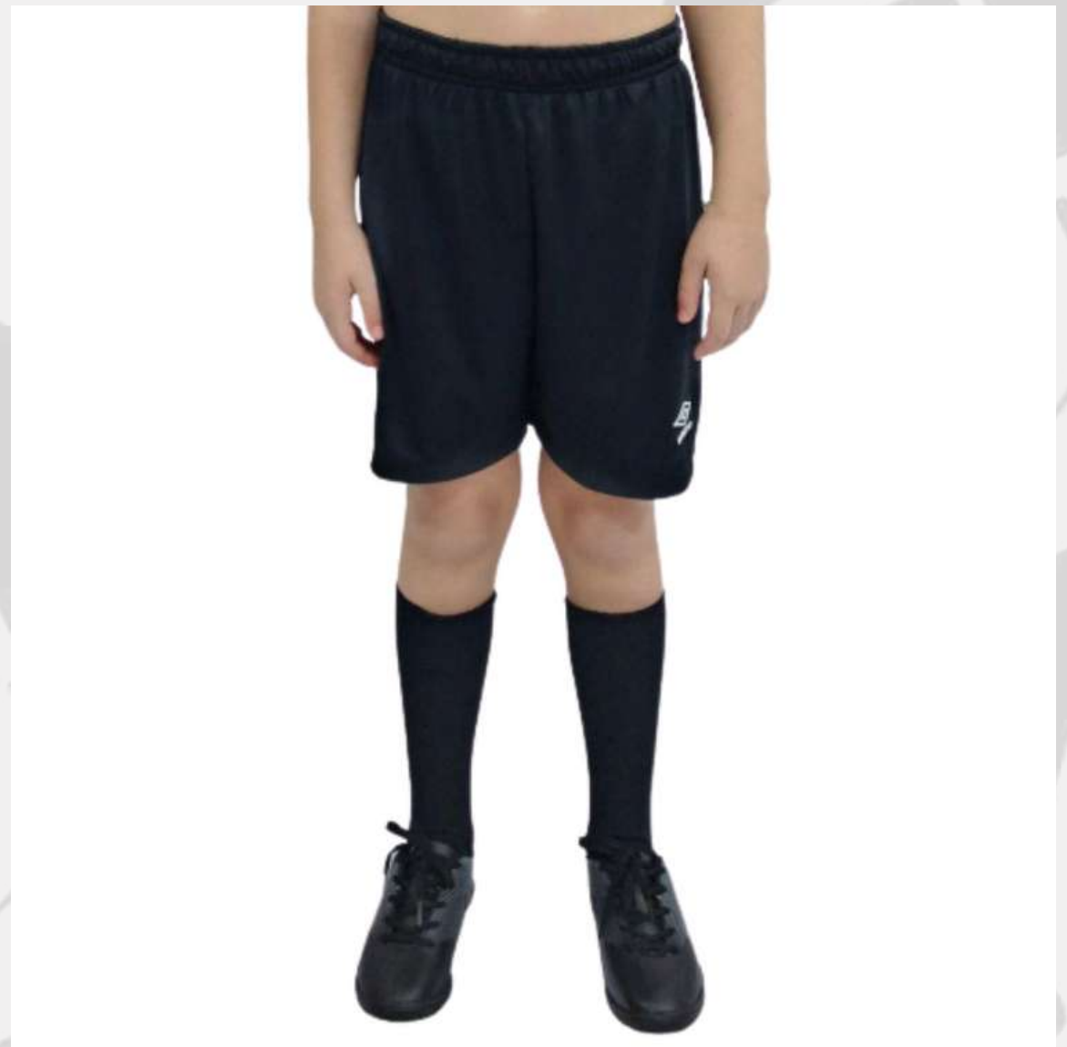
Calção Futebol Masculino Infantil (2 a 16 anos)