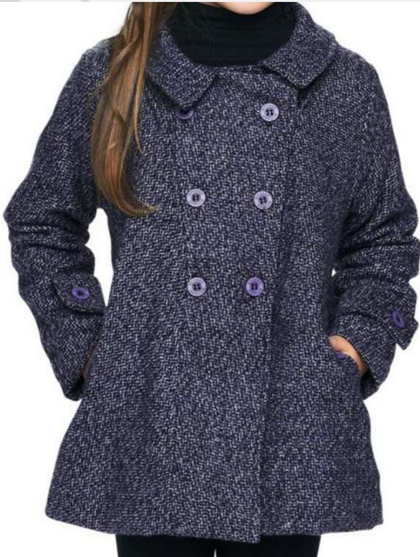
Casaco Com Forro (1 aos 14 anos)

CONFIRA ALGUNS MODELOS JAQUETAS & CASACOS