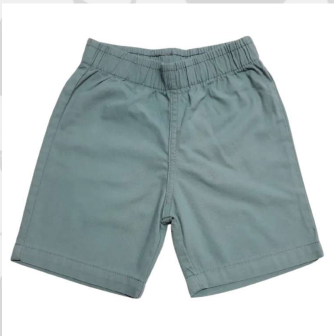
Short Básico Masculino (1 aos 12 anos)