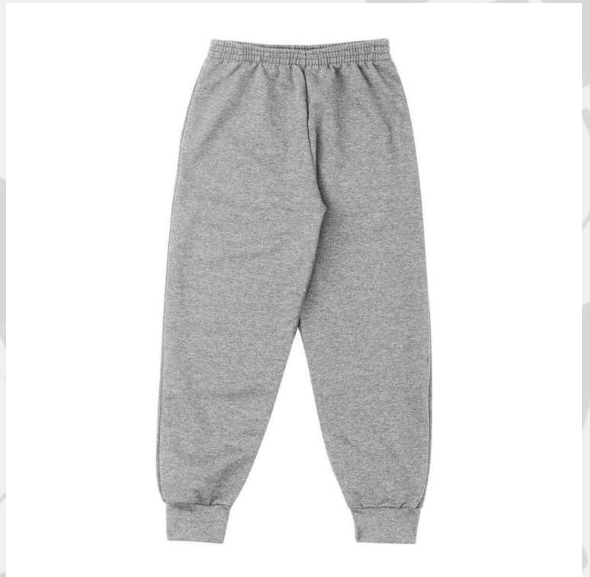
Calça Moletom Bebê (RN ao GG)