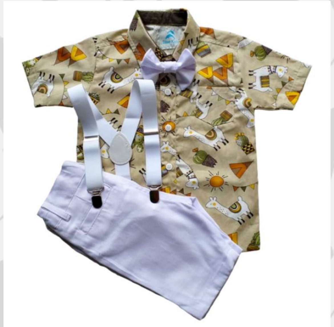
Conjuntinho Social Curto Masculino (1 aos 8 anos)