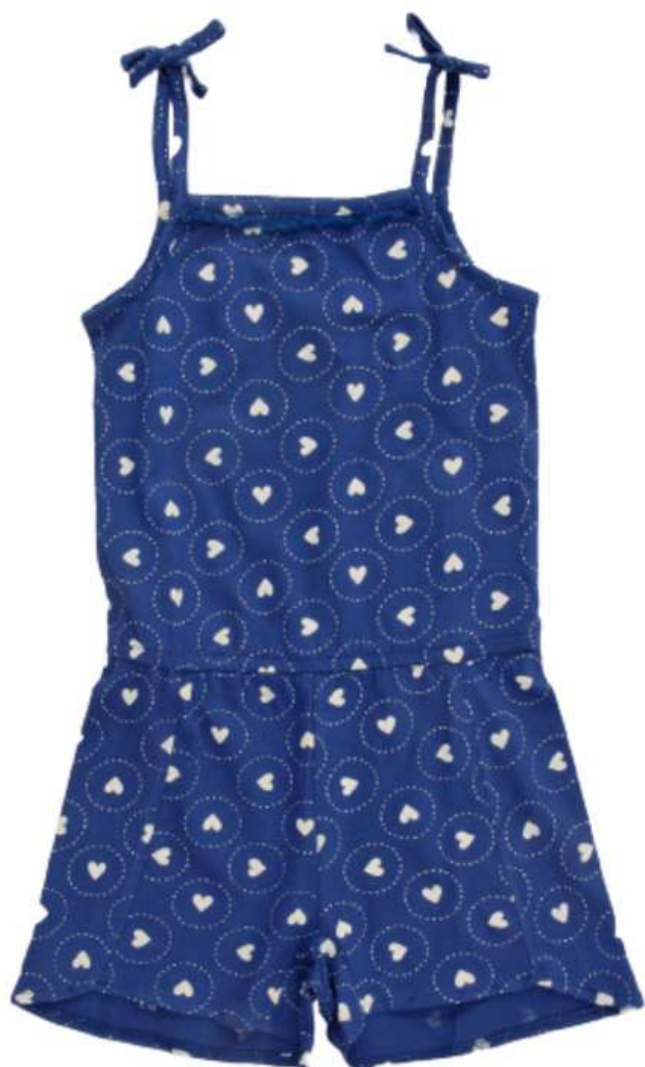
Macaquinho Com Alça (1 aos 8 anos)