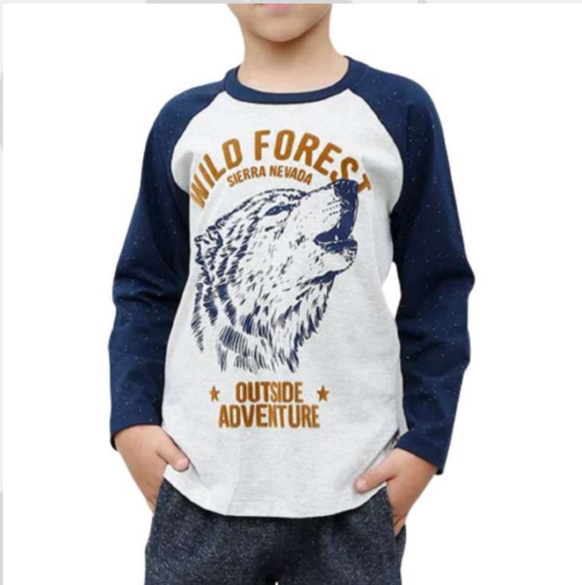
Camiseta Raglan Manga Longa Infantil (2 aos 16 anos)