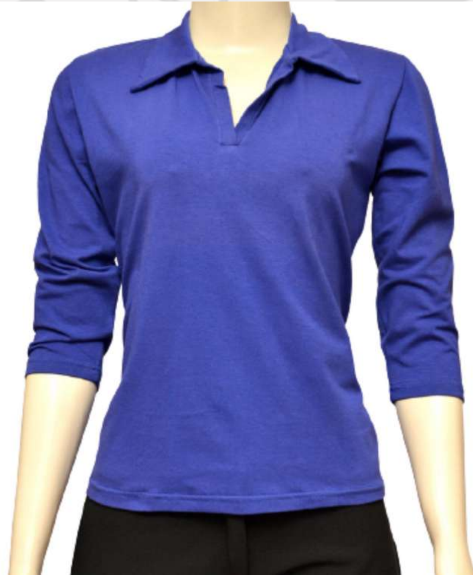
Baby look Gola Polo Raglan Manga Longa (2 aos 16 anos)