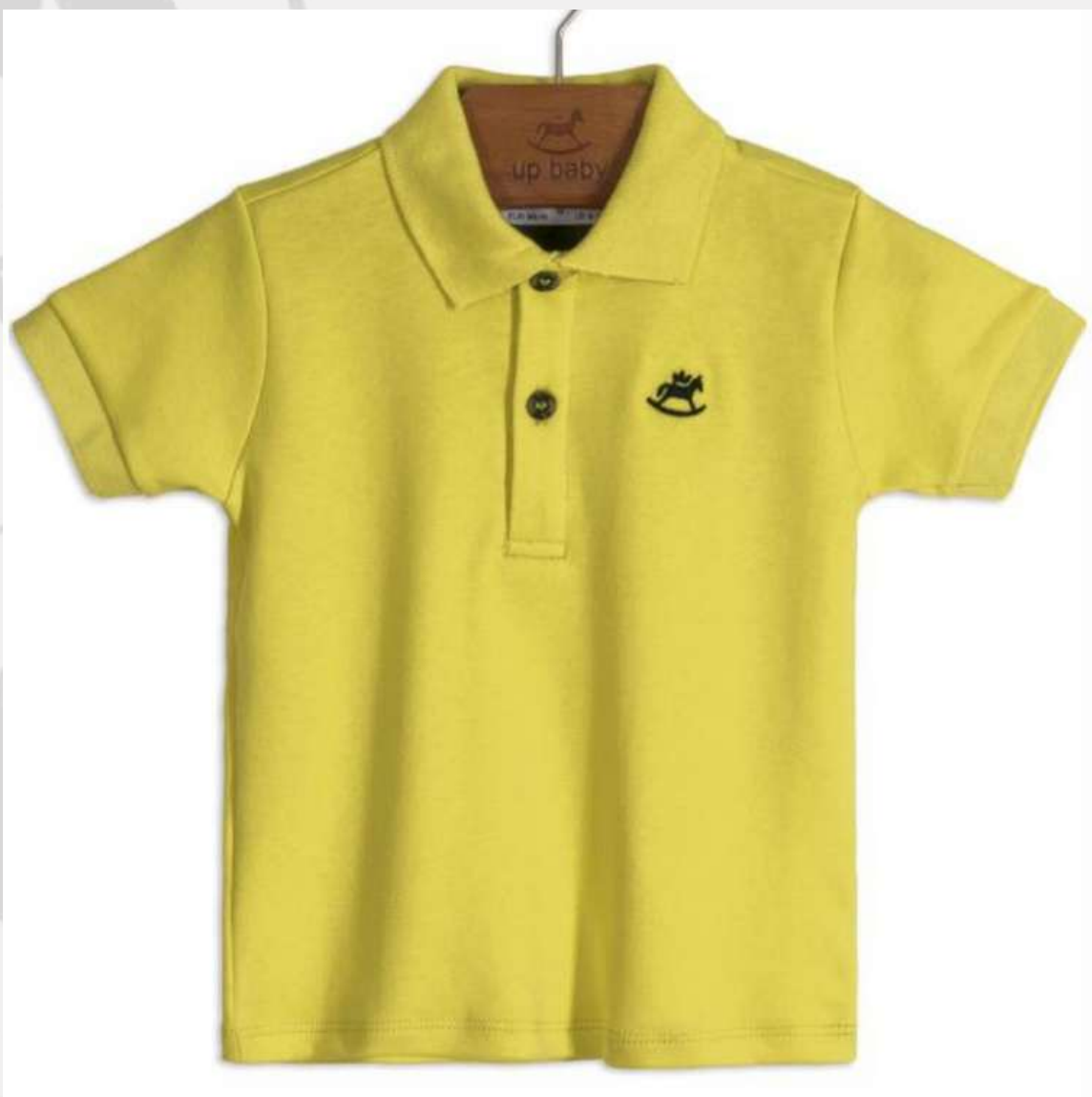
Polo Tradicional Manga Curta (2 a 16 anos)